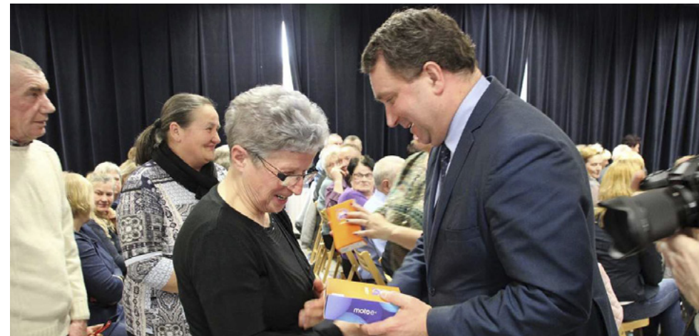
4 kwietnia 135 osób otrzymało w Kraśniku bransoletki z „Czerwonym guzikiem życia”