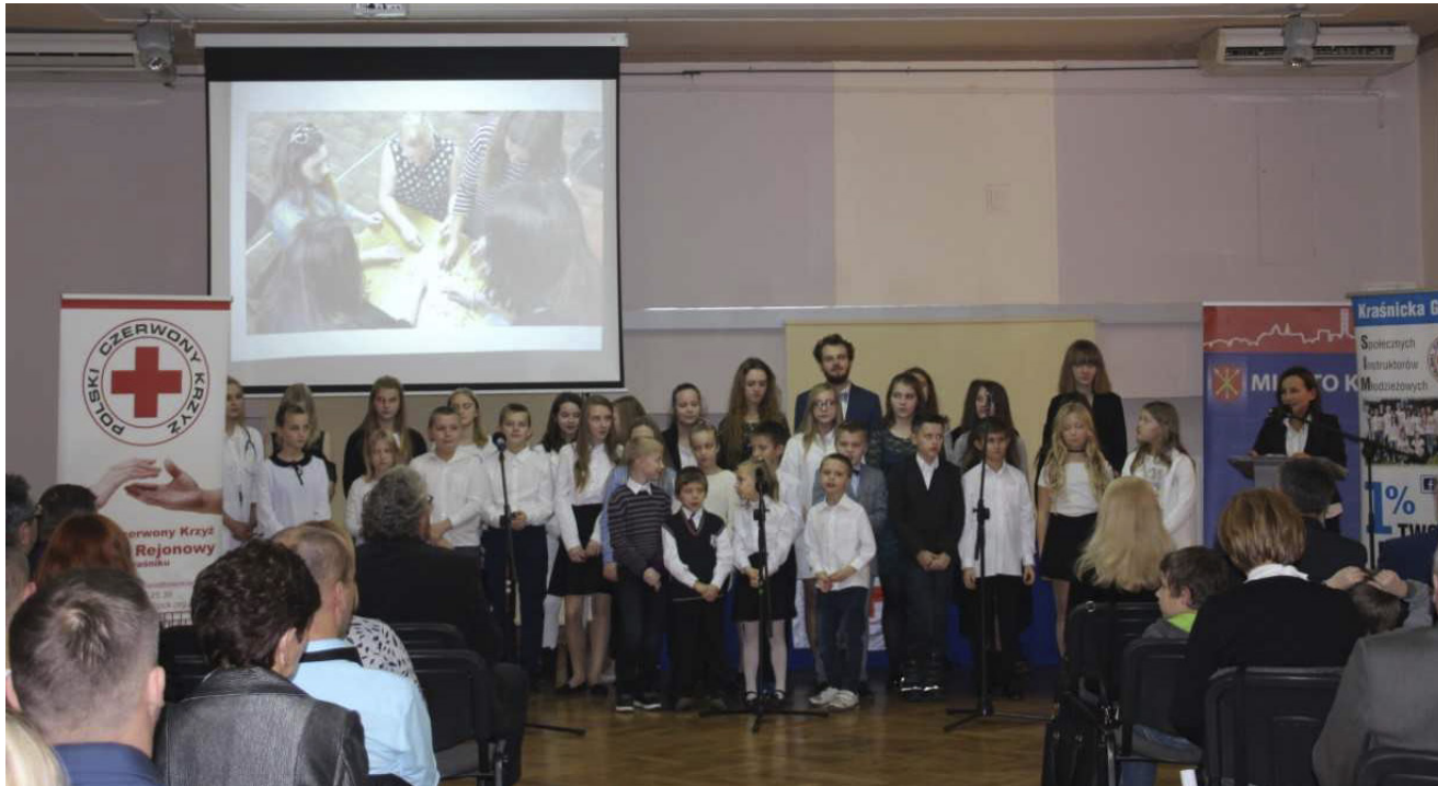
Impreza w świetlicy PCK w Kraśniku. Takich świetlic w woj. lubelskim jest jeszcze 17. Uczęszcza do nich ok. 450 dzieci

Od września w małych miejscowościach województwa lubelskiego otwierane będą świetlice. Dzieci spędzą w nich twórczo i mądrze wolny czas