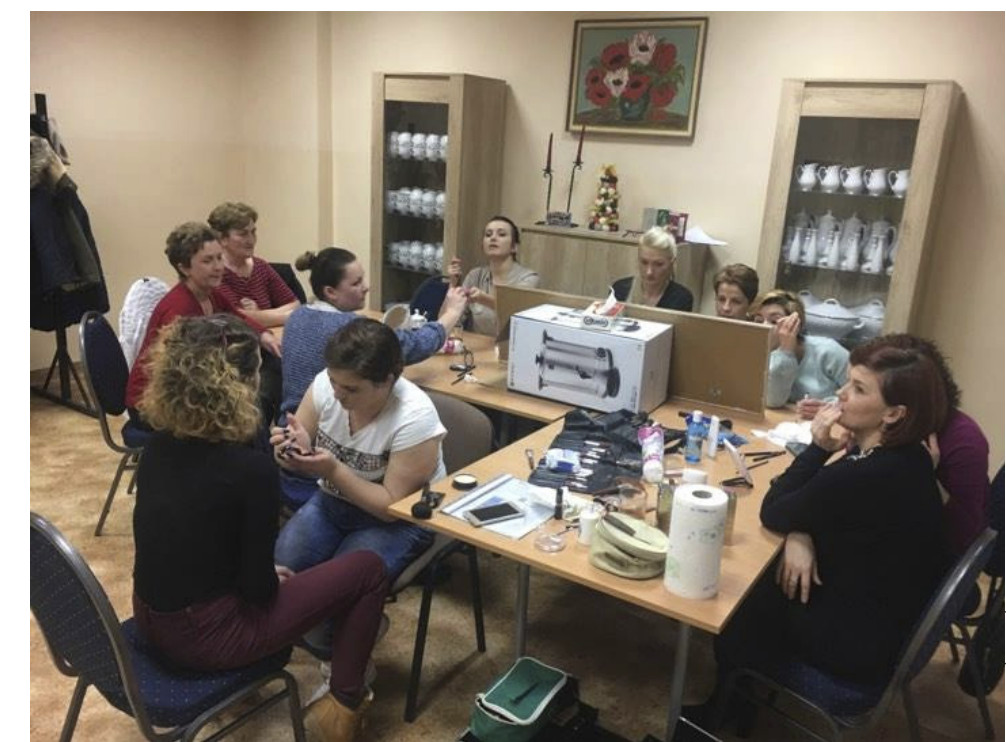
Zajęcia z wizażu w Lokalnym Ośrodku Wiedzy i Edukacji w Gościeradowie

województwa będzie wprowadzona tego typu akcja - zaznacza Maj.