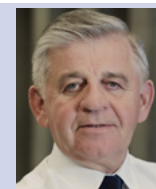
Sławomir Sosnowski marszałek województwa lubelskiego

Dotychczas sfinansowaliśmy 150 projektów na ogólną sumę ponad 470 milionów złotych. Dzięki dodatkowym pieniądząom jeszcze blisko 200 projektów otrzyma dofinansowanie. Przeznaczmy na to kolejne 600 milionów złotych. Z tych pieniędzy mogą skorzystać między innymi samorządy i ich związki lub stowarzyszenia, kościoły i związki wyznaniowe. Wsparcie, o jakie mogą się starać, obejmuje zakup i montaż instalacji solarnych lub fotowoltaicznych, pieców na biomasę lub biogaz.