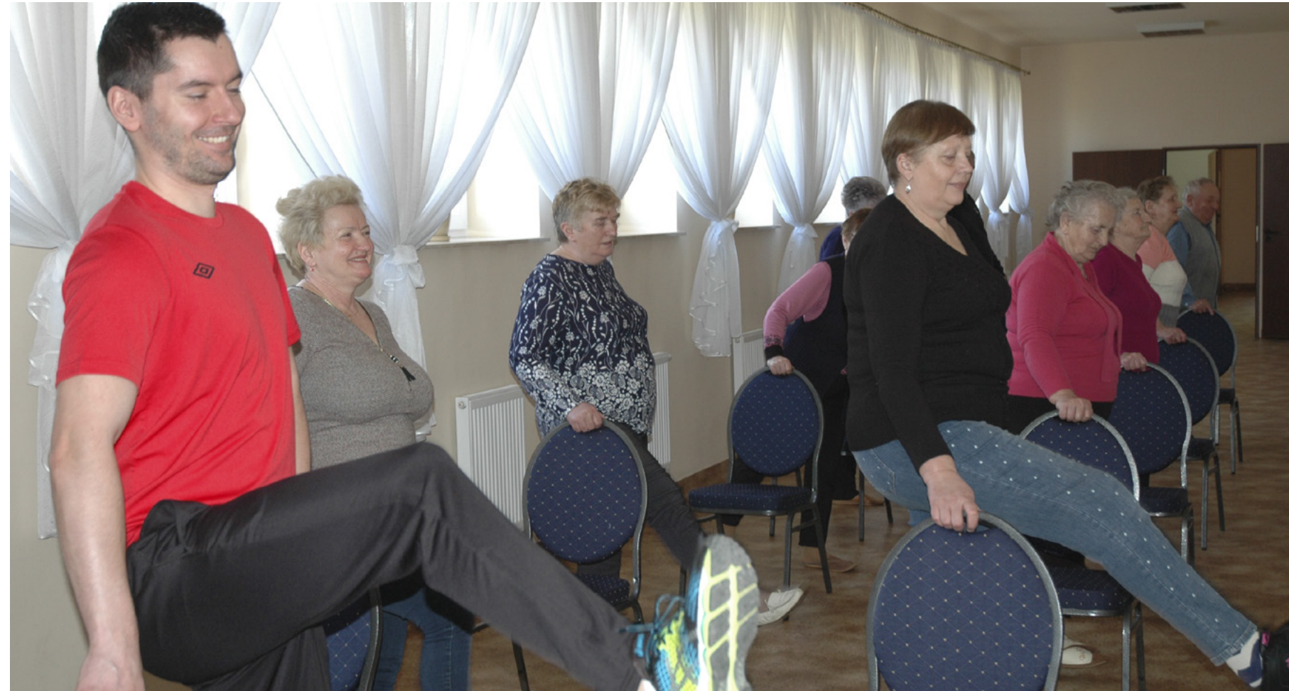
Dom Dzienny Senior+ w Salominie. W codziennych ćwiczeniach z rehabilitantem uczestniczą kilkunastoosobowe grupy mieszkańców okolicznych gmin