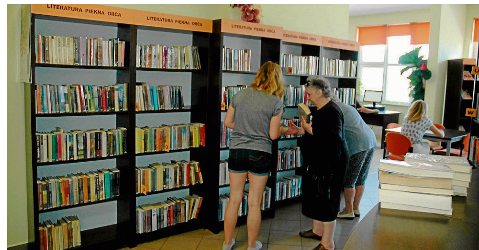
Biblioteka w Kocku to część multimedialnego muzeum, chętnie odwiedzana przez mieszkańców