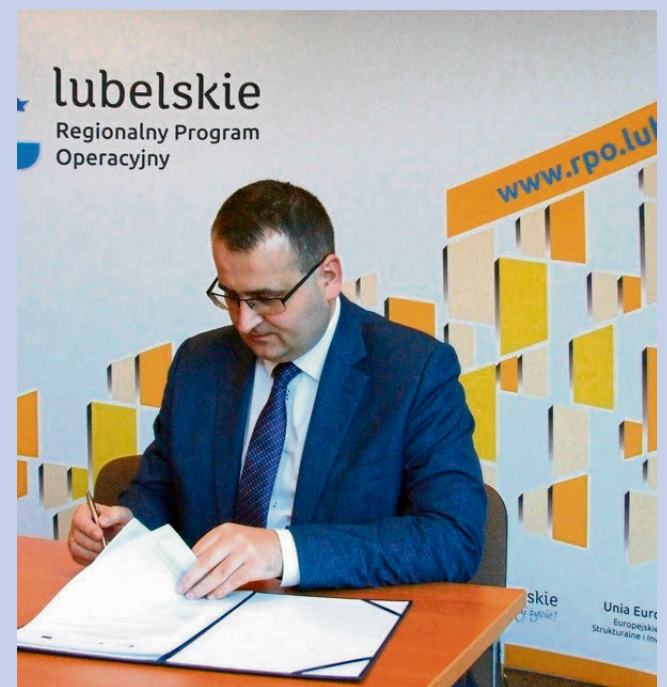
„Nasze przedszkolaki”. Na zdjęciu: Michał Cholewa, burmistrz Piask

Publikacja współfinansowana ze środków Unii Europejskiej w ramach Europejskiego Funduszu Społecznego