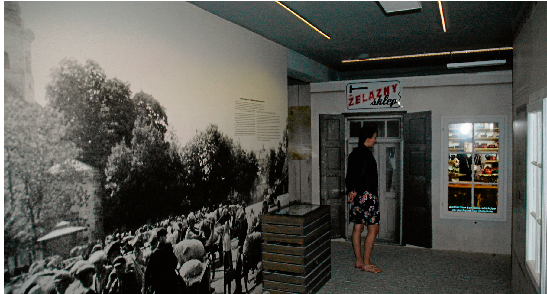
Z dawnej, ciasnej izby regionalnej w Kocku powstało multimedialne, nowoczesne muzeum. Wzbudza spore zainteresowanie dzieci i młodzieży

W ankiecie mieszkańcy zaznaczyli swoje oczekiwania względem Gminnego Centrum Kultury. Dzieci chcą tworzyć w pracowni plastycznej i modelarskiej. Padła propozycja stworzenia ścianki wspinaczkowej. Jedni marzą o sekcji fitness, a drudzy o sali z wielkim telewizorem, by wspólnie oglądać np. mecze. Seniorzy chcą się spotykać i zapraszać ciekawych ludzi. Marzenia mieszkańców Wohynia wkrótce się spełnia. Stary budynek, w którym w czasach PRL mieściła się GS, przekształca się w Gminne Centrum Kultury. Praca nabiera tempa. Otwarcie ma nastąpić 31 sierpnia. Front jest skończony. Tylko ściany będą pokryte czarnym klinierem. Budynek przechodzi metamorfozę. Klatka schodowa została przebudowana, będzie winda. Wymieniono okna, drzwi, instalację wodną i weni-