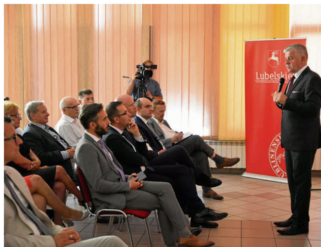
W spotkaniu z przedsiębiorcami w Parczewie uczestniczył marszałek województwa Sławomir Sosnowski

Ogólna pula pieniędzy przeznaczona na dofinansowanie projektów to prawie 100 milionów złotych. Wykaz potrzebnych dokumentów i wymagania, które należy spełnić, można znaleźć na stronie www.rpo.lubelskie.pl .