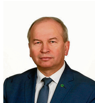
Zenon Rodzik starosta opoleński

Paweł Pikula jest starostą od 2001 r. Od tego czasu powiat skutecznie pozyskuje fundusze z różnych źródeł zewnętrznych, które przeznacza przede wszystkim na rozwój infrastruktury drogowej, szkolnictwa i informatyzację. W trakcie realizacji są trzy duże projekty edukacyjne, których celem jest doposażenie bazy dydaktycznej szkół zawodowych.