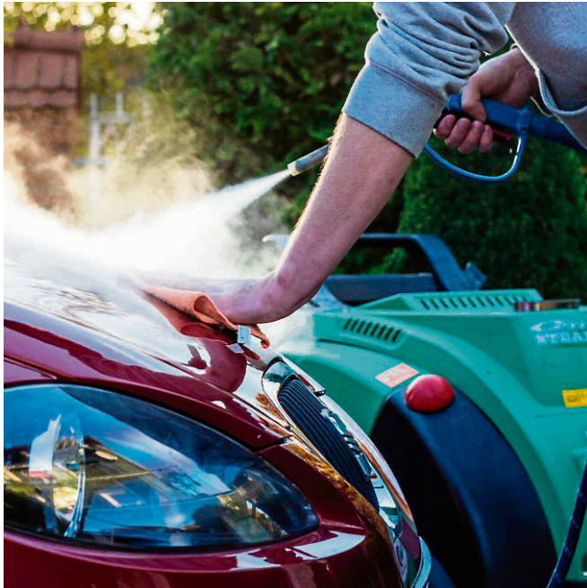
Pracownicy przedsiębiorstwa społecznego CleanCity&Events pracują w myjni parowej i organizują imprezy dla dzieci

Przedsiębiorstwo, które otrzymało 120 tys. zł wsparcia, zaczynało od jednej myjni, która działa przy ul. Wojciechowskiej 5A. Obecnie z ich usług można skorzystać także przy lubelskim centrum handlowym Ikea. Jeden i drugi punkt działa od poniedziałku do soboty w godzinach 10 - 18. Poza tym Clean City&Events dojeżdża na mycie auta do klienta. Z jego usług przy myciu samochodów do przewozu żywności