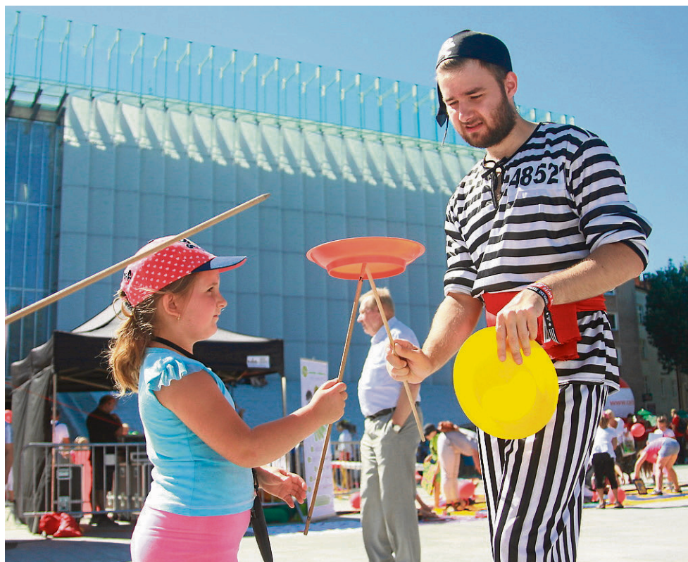
Plac Teatralny przed Centrum Spotkania Kultur jest miejscem wielu imprez

W minionym okresie również dzięki dotacjom z funduszy unijnych i samorządu województwa lubelskiego, który