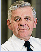
Sławomir Sosnowski marszałek województwa lubelskiego

Zajęcie II miejsca w Polsce w wydatkowaniu pieniędzy z Europejskiego Funduszu Społecznego zawdzięczamy oczywiście beneficjentom. Bez ich aktywności nie osiągnęlibyśmy tego imponującego wyniku. Serdecznie dziękuję wszystkim wnioskodawcom za zaufanie i już realizowane wspólnie projekty.