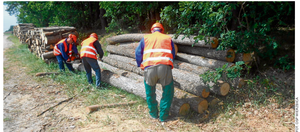
Podopieczni Ośrodka Pomocy Społecznej w Wierzbicy podczas kursu operatora pilarki