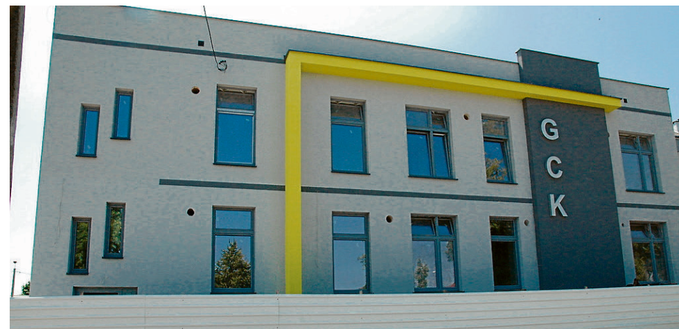
W Wohyniu wkrótce otwarcie Gminnego Centrum Kultury