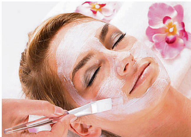
Uczestniczki programu otworzyły m.in. salony kosmetyczne

Pomysły na własną firmę były różne - prowadzenie salonu kosmetycznego, salonu masażu, strzyżenie psów, prowadzenie animacji dla dzieci czy otwarcie kancelarii adwokackiej. Bez-