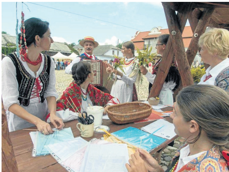
Inszenizacja odpustu na rynku przedwojennego