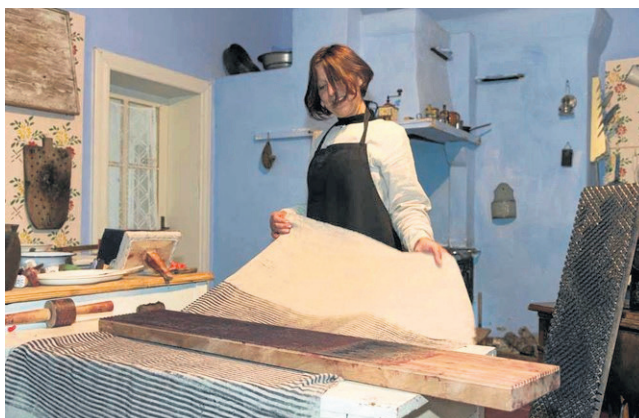
Pokaz druku wzoru na płótnie