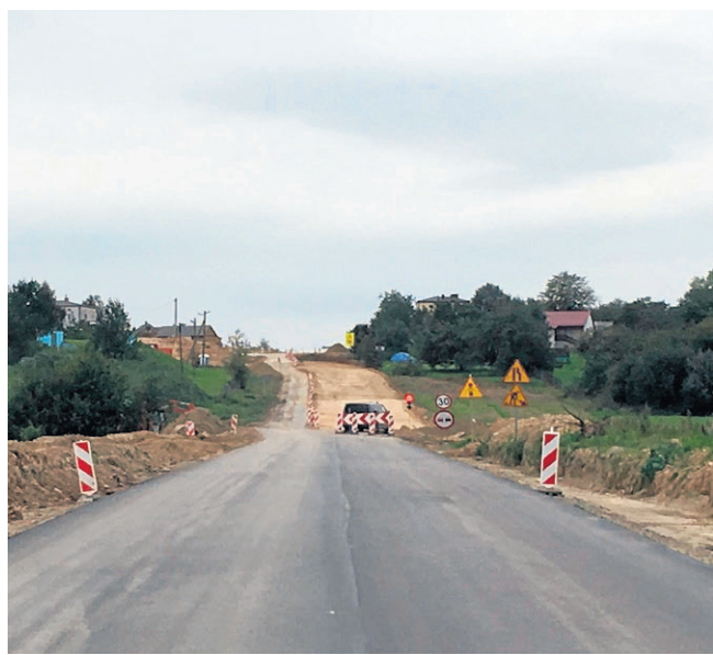
Przebudowa drogi wojewódzkiej 836 koło Piotrkowa

Realizowana inwestycja będzie miała korzystny wpływ na wszystkie grupy użytkowników drogi: uczestników ruchu tranzytowego, lokalnych mieszkańców, inwestorów oraz turystów. W wyniku realizacji projektu nastąpi poprawa bezpieczeństwa ruchu użytkowników drogi, skróci się czas przejazdu do miejsc docelowych. Zwiększenie nośności drogi umożliwi też poruszanie się ciężkich pojazdów, co służyć będzie rozwojowi gospodarczemu przyległych miejscowości i gmin.