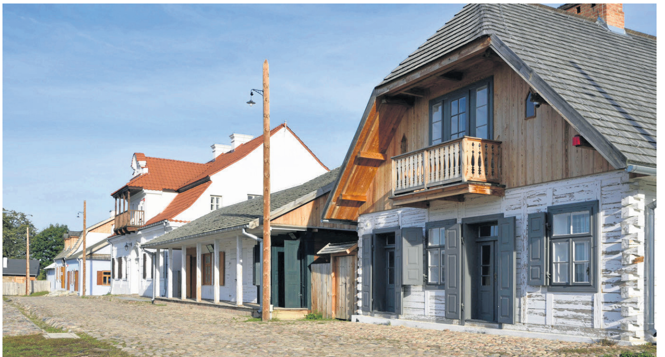
Ulica Głuska wiernie odtwarza wygląd i klimat przedwojennego prowincjonalnego miasteczka Europy Środkowej

Budowa jednej pierzei miasteczka, w skład której wchodzi 13 obiektów, została sfinansowana ze środków RPO Województwa Lubelskiego na lata 2007 - 2013 oraz z dotacji budżetu Samorządu Województwa Lubelskiego. Całkowity koszt inwestycji wyniósł 13 mln zł, w tym dofinansowanie z RPO 7,5 mln zł.