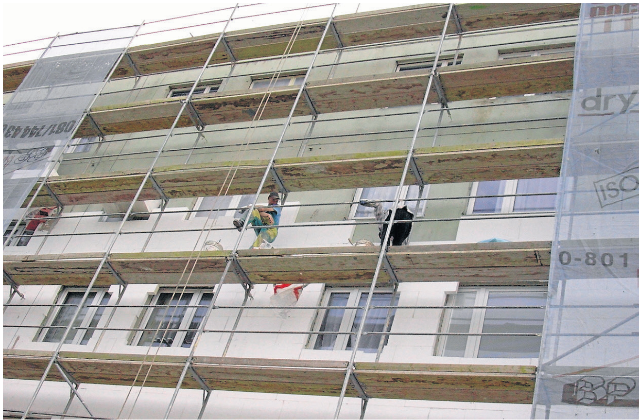
Spółdzielnia Mieszkaniowa im. W. Łukasińskiego w Zamościu docięła już kilkanaście budynków. Teraz rozpocznie prace na kolejnych 17.

Termomodernizacja osiedli mieszkaniowych jest konieczna. Większość bloków w kraju budowana była w czasach, gdy koszty energii były dużo niższe niż obecnie. Poza tym budynki stawiano w zupełnie innych technologiach, projektowane według starych wytycznych, bez ciepłych izolacji. Wysoką temperaturę wewnątrz uzyskiwano dzięki rozbudowanym, a obecnie przestarzałym, systemom grzewczym. W obecnych czasach, przy obowiązujących cenach za energię, dawne rozwiązania nie sprawdzają się, powodują straty ciepła i finansowe. Zdaniem specjalistów, by obniżyć koszty i mniej zużywać energii nie wystarczy tylko termomodernizacja. Istotne są także inne ulepszenia techniczne w różnych dziedzinach w zakresie ogrzewania, wentylacji, ewentualnego chłodzenia, przygotowania ciepłej wody i oświetlenia pomieszczeń. Duży wpływ na obniżenie kosztów ma wykorzystanie