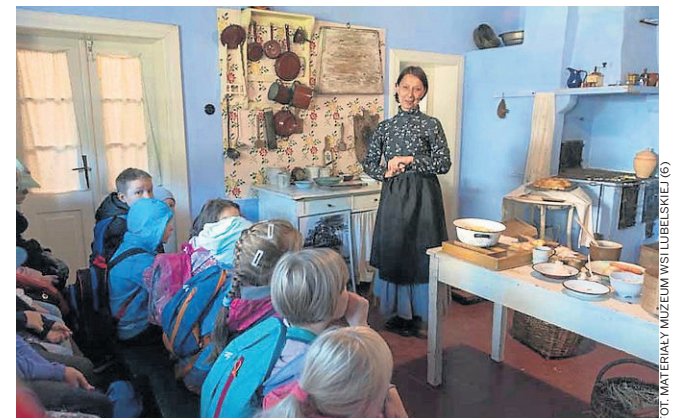
Lekcja historii w kuchni żydowskiej