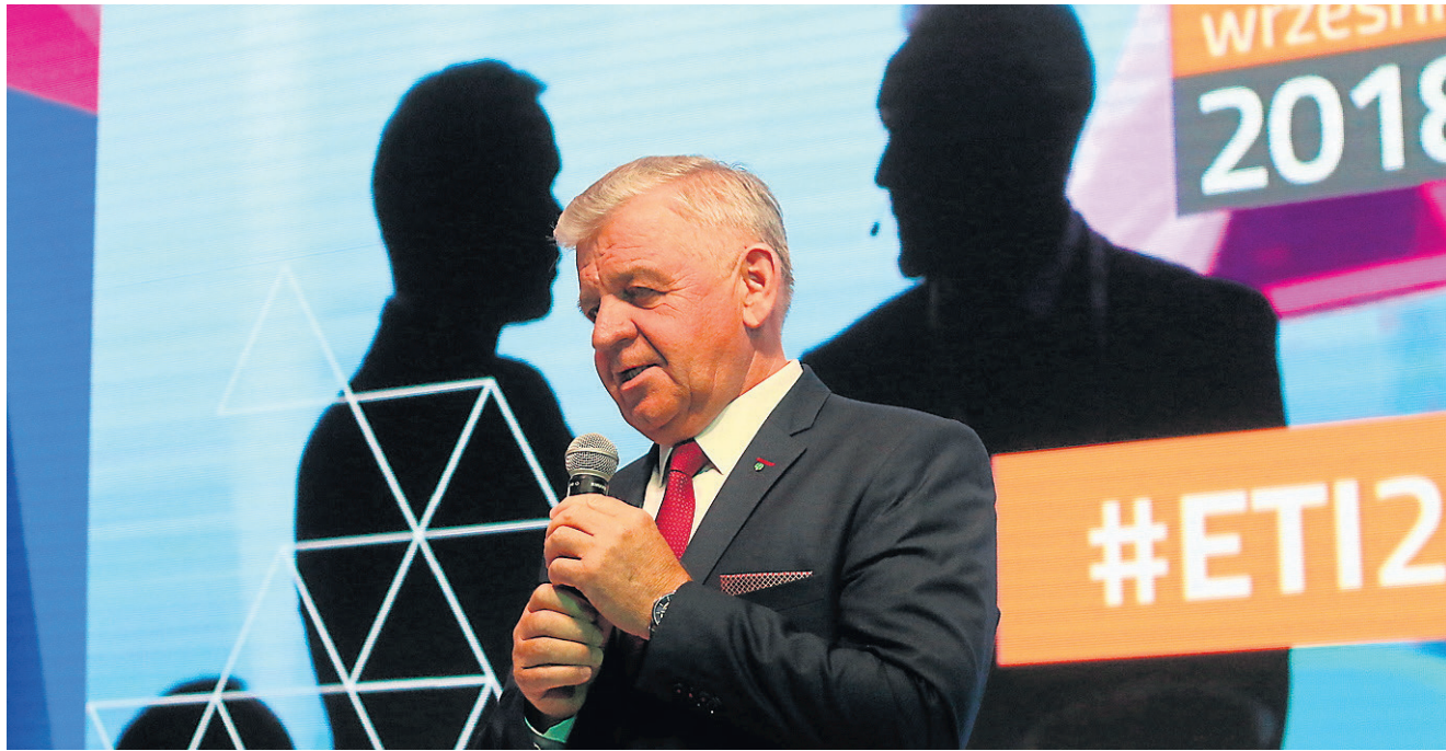
- Mam nadzieję, że współpraca przedsiębiorstw, uczelni i regionu przyczyni się do rozwoju - mówił marszałek Sławomir Sosnowski

W ramach ETI dziewięć start-upów rywalizowało o pieniądze na realizację swojej wizji. Nagrodę w wysokości 20 tys. zł zdobył New Wall. Dwa kolejne start-upy, Biolive Innovation i Breather One, zostały zaproszone do negocjacji na temat wejścia kapitałowego. W grę wchodzi nawet 1,5 mln zł. A to tylko mała próbka możliwości przedsiębiorców z naszego regionu. Szacuje się, że w Lublinie znajduje się około 100 start-upów. Pod względem liczby młodych i innowacyjnych