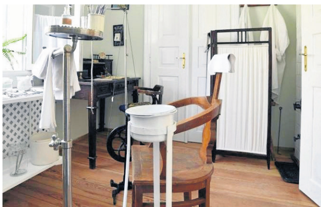
Tak wyglądał kiedyś gabinet dentystyczny