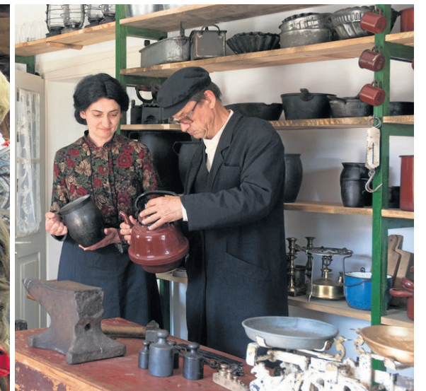
W sklepie żelaznym