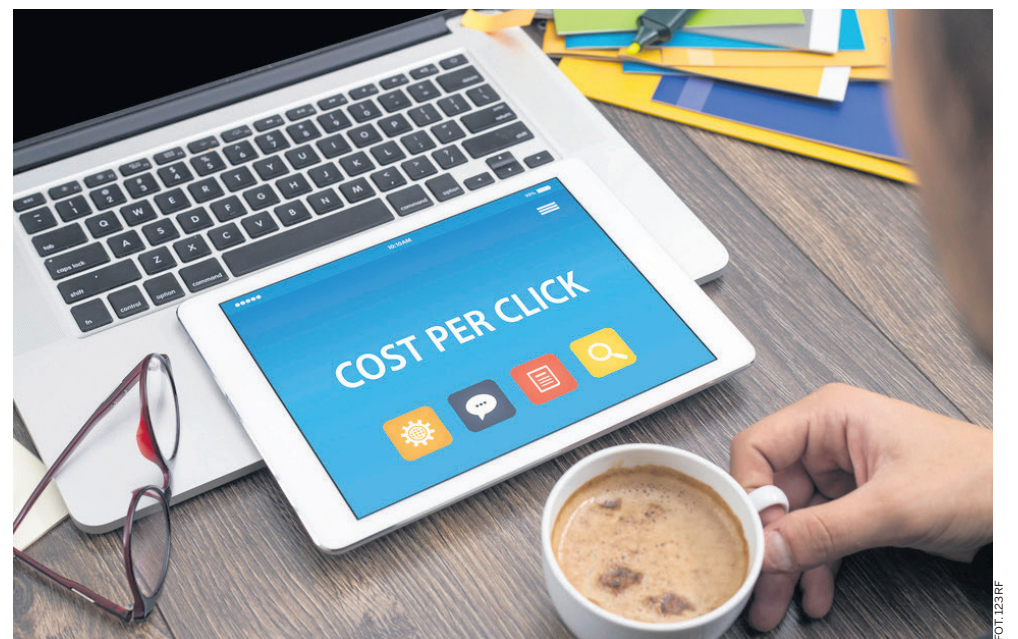
E-marketing dotyczy różnych branż, a osoby z tymi umiejętnościami są poszukiwane na rynku pracy

Do tej pory Fundacja Inicjatyw Menedżerskich przeprowadziła dwa etapy szkoleń. Kursy