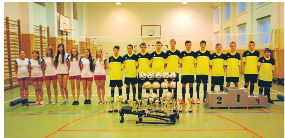
Młodzi piłkarze i zespół siatkarek dziewcząt są sportową dumą mieszkańców Łabuńki