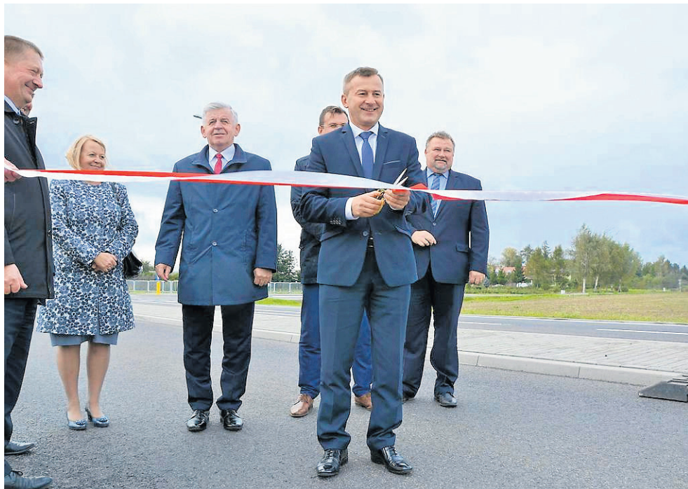
Członkowie Zarządu Województwa otwierają drogę Lublin-Opole

To nie koniec dobrych wiadomości dla mieszkańców naszego regionu. W roku 100-lecia odzyskania przez Polskę niepodległości Samorząd Województwa Lubelskiego realizuje akcję budowy i modernizacji dróg pod hasłem „100 km dróg w każdym powiecie województwa lubelskiego na 100-lecie Niepodległości”. Do programu