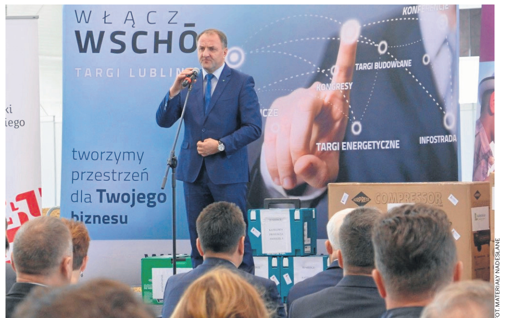
Wicemarszałek województwa Grzegorz Kapusta: - Mamy wiele form pomocy dla przedsiębiorców

- W powiecie realizowanych jest też wiele projektów umożliwiających jego mieszkańcom założenie własnej działalności gospodarczej, obejmujących pomocne w tym szkolenia, dotacje, wsparcie pomostowe czy pożyczki. Wartość największego z nich sięga niemal 5 mln zł - mówi wicemarszałek województwa Grzegorz Kapusta .