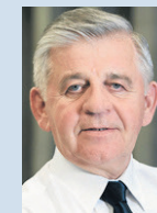
Sławomir Sosnowski marszałek województwa lubelskiego

Projekty realizowane są na terenie czterech podregionów: bialskiego, chełmsko-zamojskiego, lubelskiego i puławskiego. Badania wykonać można w wielu szpitalach i innych placówkach opieki medycznej we Włodawie, Parczewie, Białej Podlaskiej, Lublinie, Biłgoraju, Łęcznej, Bełżycach, Kra-