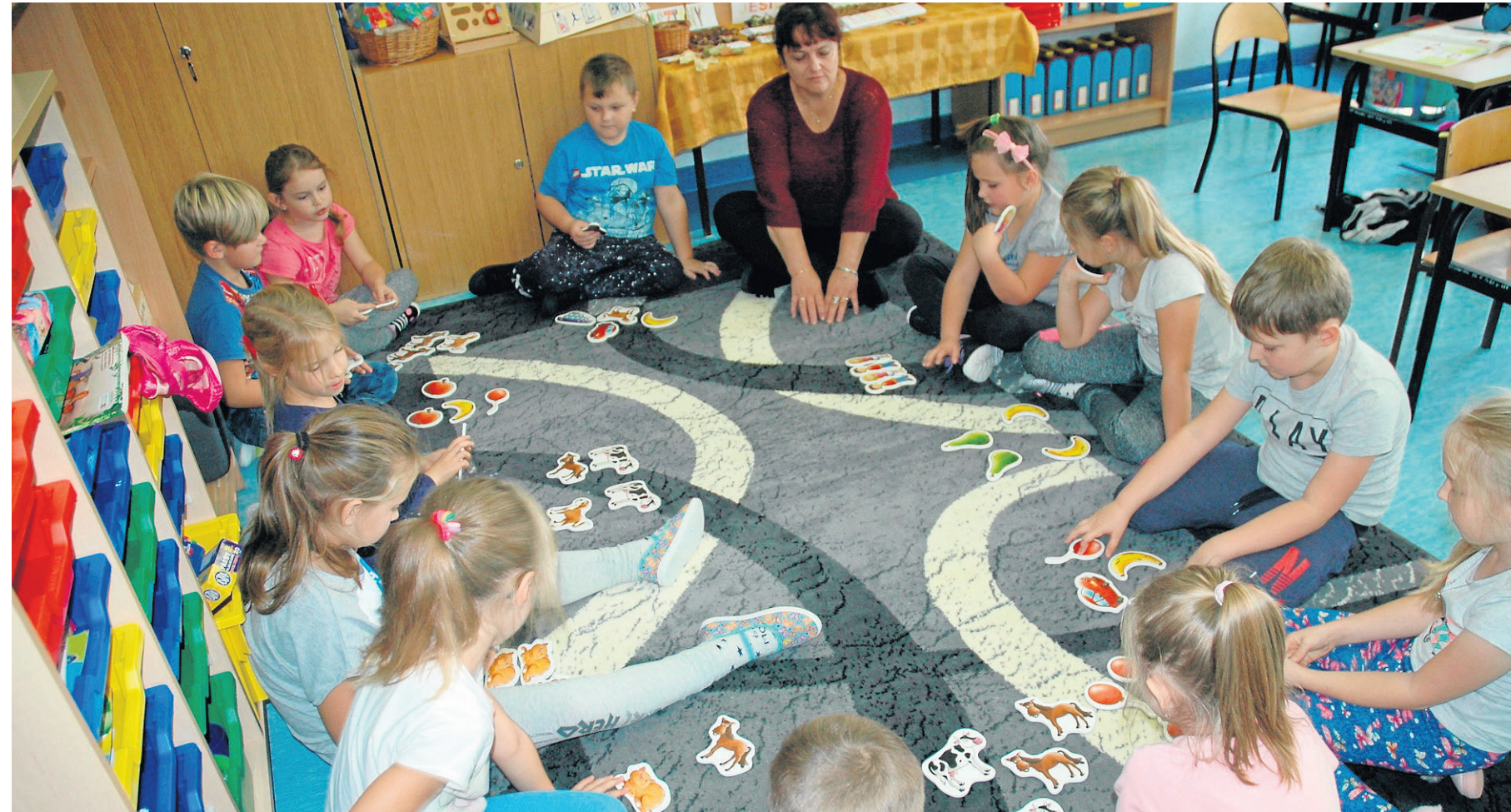
Lekcja matematyki w klasach młodszych w szkole podstawowej w Łabuniach Pierwszych. Uczniowie poznają zasady tworzenia zbiorów