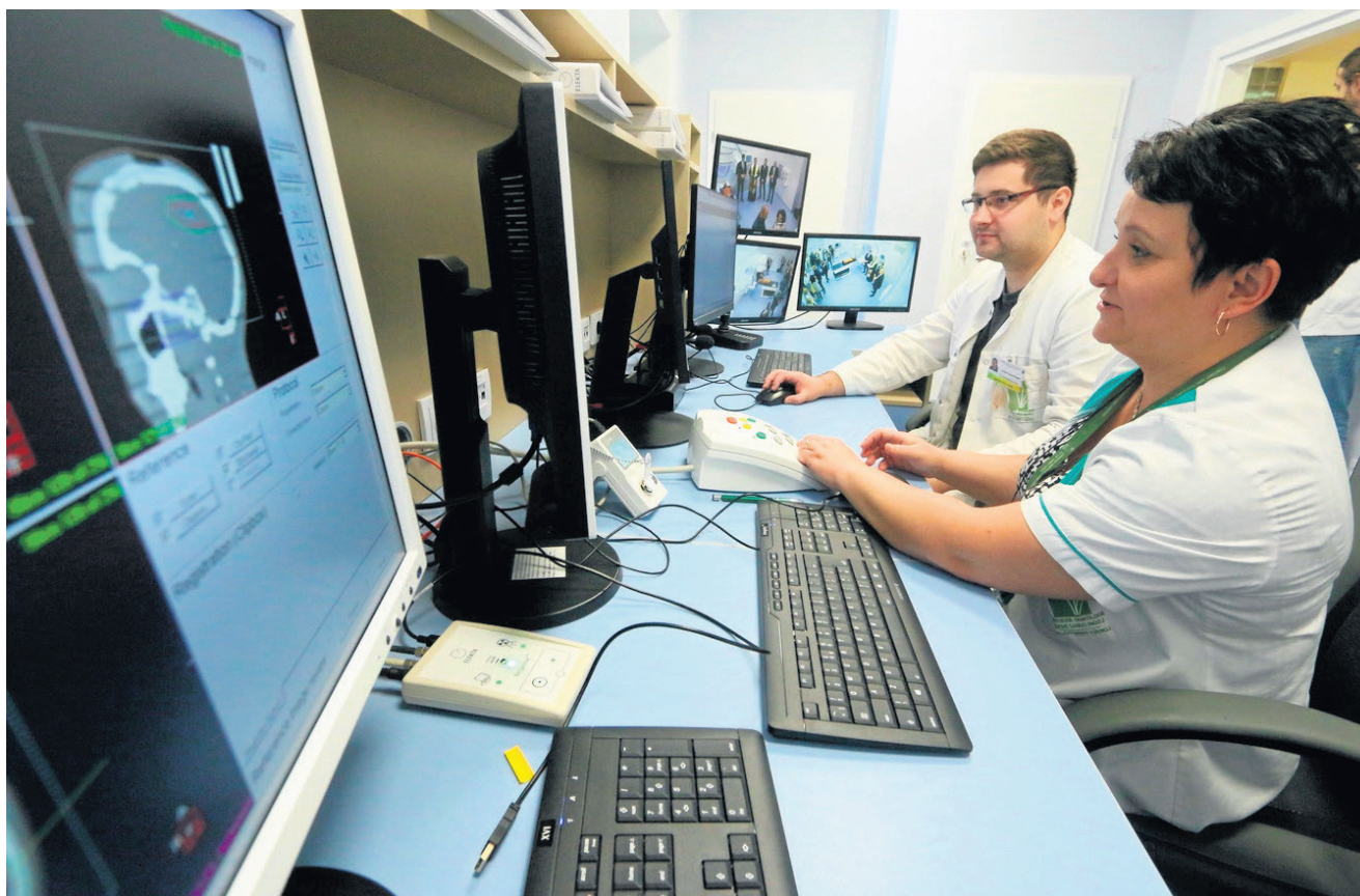
W badaniach profilaktycznych nowotworów wykorzystuje się najnowocześniejszy sprzęt diagnostyczny

- W odpowiedzi na ten palący problem Zarząd Województwa ogłosił dotąd kilka konkursów poświęconych