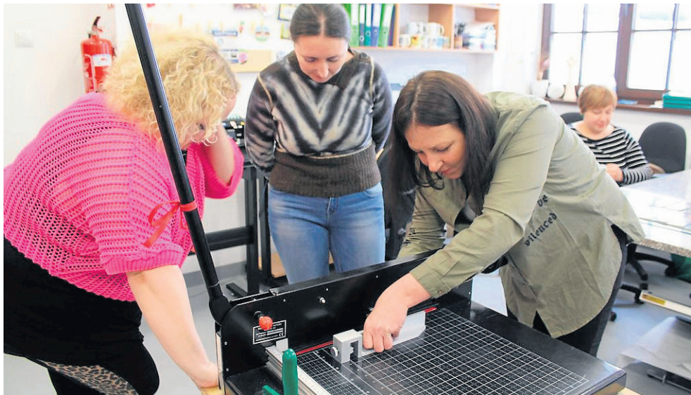
Podopieczni MOPS w Krasnymstawie na zajęciach przyuczających do zawodu introligatora

Szansa na aktywizację zawodową dzięki płatnym stażom, pracom społecznym i tematycznym warsztatom - Miejski Ośrodek Pomocy Społecznej w Krasnymstawie realizuje projekt „Aktywność popłaca”