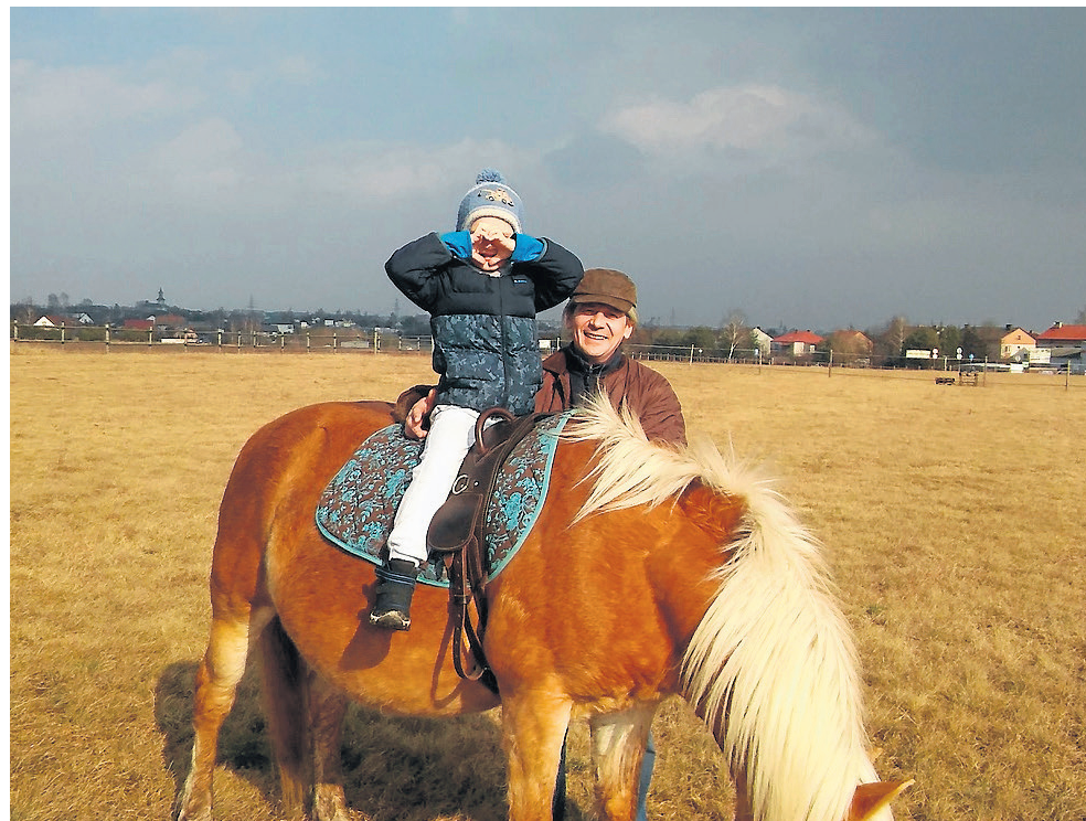
Na zajęcia hipoterapii rodzice nie muszą już wozić dzieci do okolicznych miejscowości. Teraz mają je na miejscu - we Włodawie