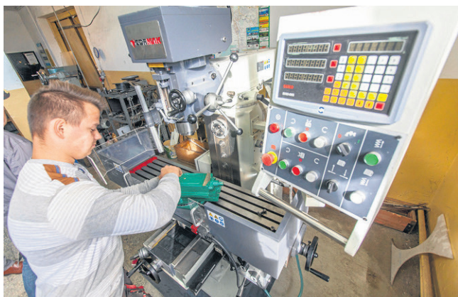
Zespół Szkół Techniki Rolniczej w Piotrowicach: praca na obrabiarce numerycznej i nauka jazdy ciągnikiem