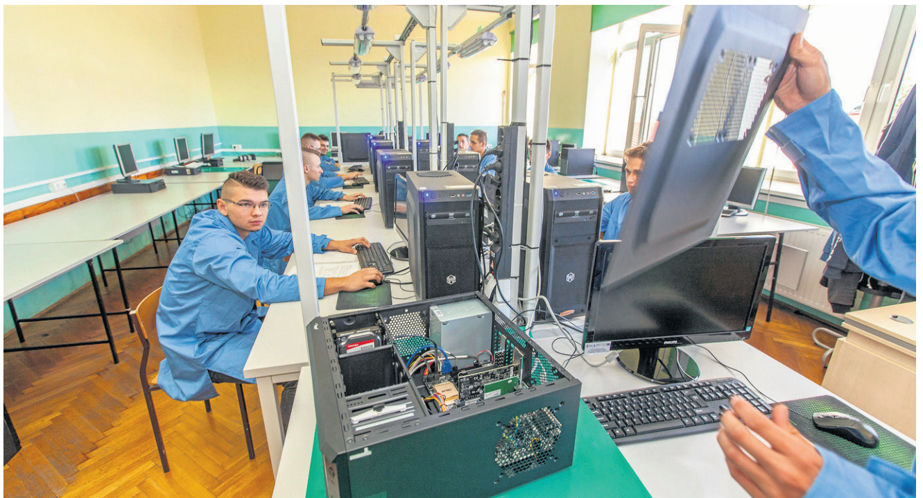
Pracownia komputerowa w Zespole Szkół im. Mikołaja Kopernika w Bełżycach

Projekt realizowany będzie do końca lipca 2019 r. Jego łączna wartość to ponad 4 mln zł, a głównym celem jest zwiększenie szans na zatrudnienie tych młodych ludzi poprzez dopasowanie ich wykształcenia do potrzeb rynku pracy.