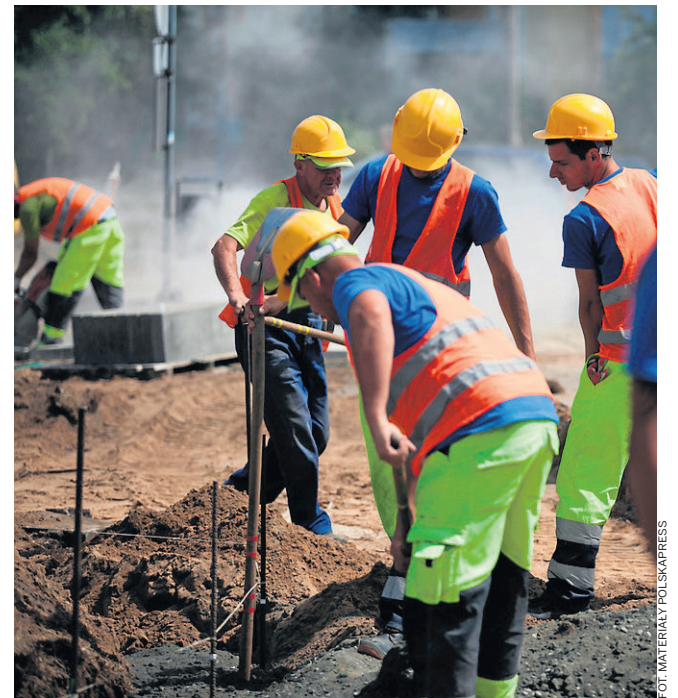
Na remonty i modernizację dróg wydamy ponad 600 mln zł

Część drogi wojewódzkiej 812, z Włodawy w kierunku Białej Podlaskiej, także już