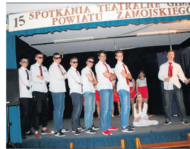
Koło teatralne ze szkoły w Łabuniach Pierwszych zdobywa laury na przeglądach i festiwalach