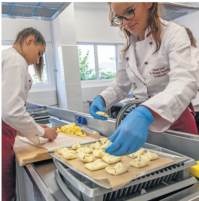
Pracownia żywieniowa w Zespole Szkół w Bełżycach powstała przy wsparciu RPO w ramach Europejskiego Funduszu Społecznego i znacznym udziale środków własnych powiatu