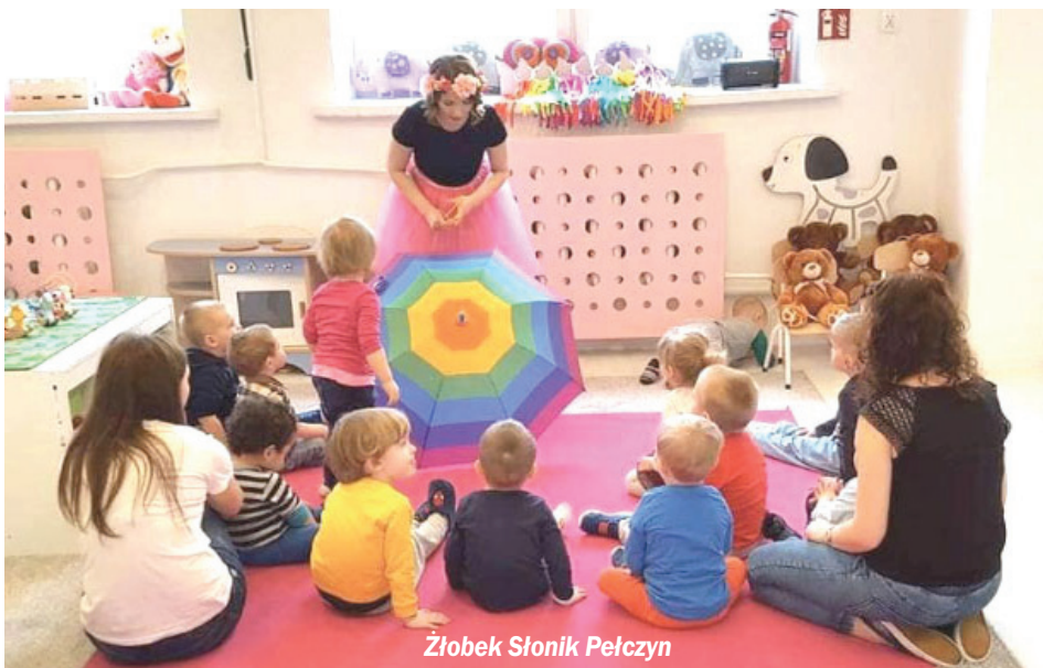
Żłobek Słonik Pełczyn

- W ramach projektu rekrutowani byli rodzice,