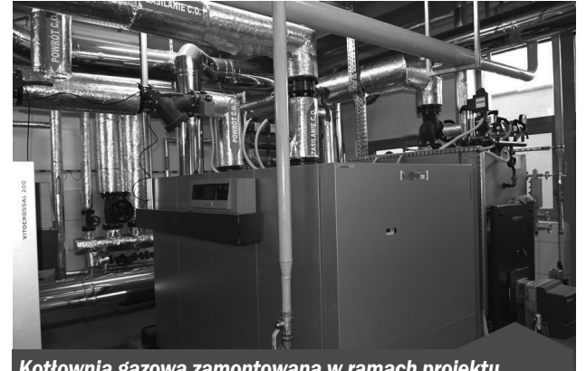
Kotłownia gazowa zamontowana w ramach projektu