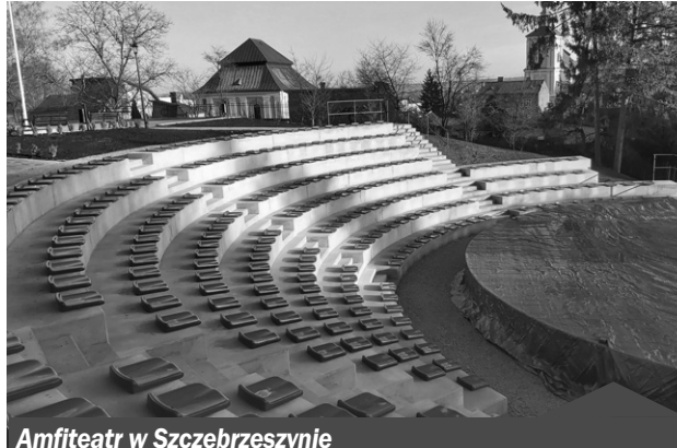
Amfiteatr w Szczebrzeszynie