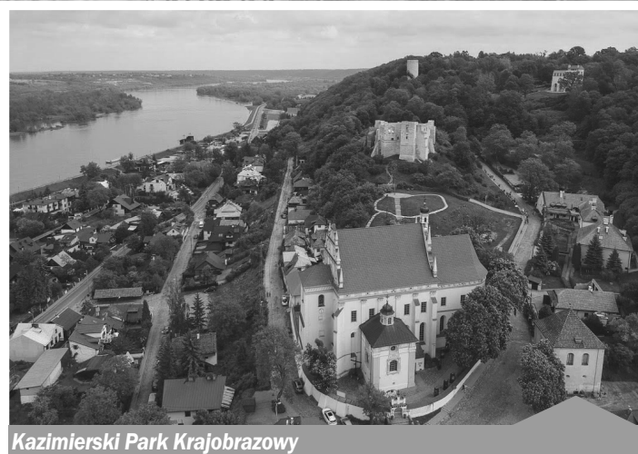
Kazimierski Park Krajobrazowy