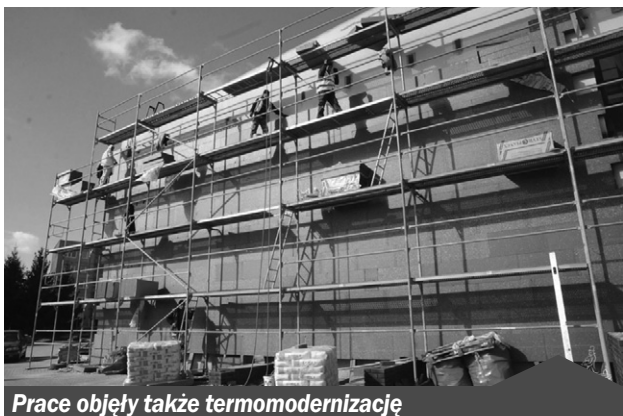
Prace objęły także termomodernizację