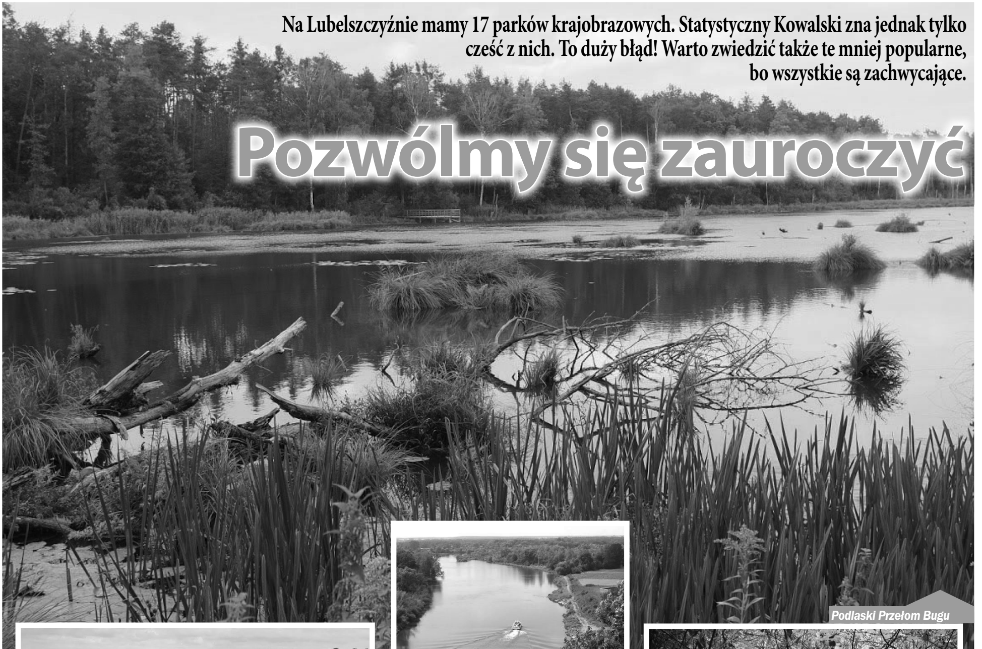
Podlaski Przełom Bugu