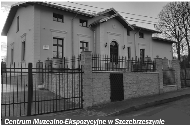
Centrum Muzealno-Ekspozycyjne w Szczebrzeszynie

Dzięki dofinansowaniu z Regionalnego Programu Operacyjnego Województwa Lubelskiego udało się w ubiegłym roku ukończyć w Szczebrzeszynie dwa duże projekty związane zarazem z edukacją i ochroną środowiska. W tym roku pora na kolejne działania.