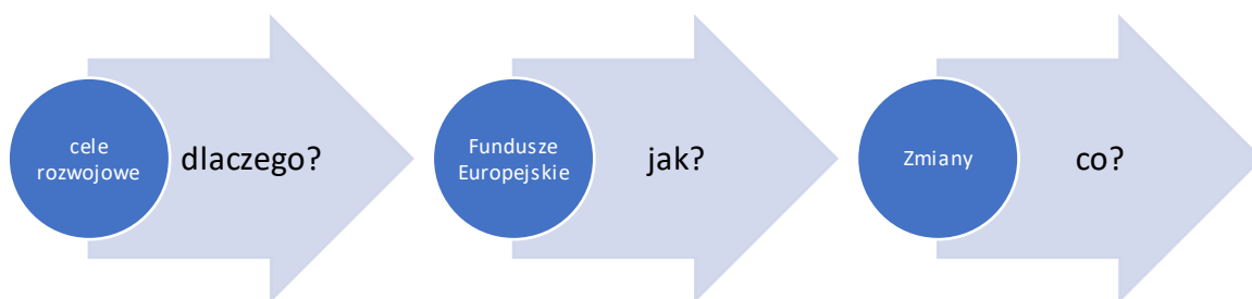
Rys. 1. Schemat: Jak formułować przekaz na temat Funduszy Europejskich?

Kiedy przystępujemy do tworzenia przekazu o Funduszach Europejskich, powinniśmy posługiwać się schematem (rys. 1). Nie ma znaczenia to, czy są to działania informacyjne czy promocyjne i do kogo je kierujemy. Schemat jest uniwersalny.