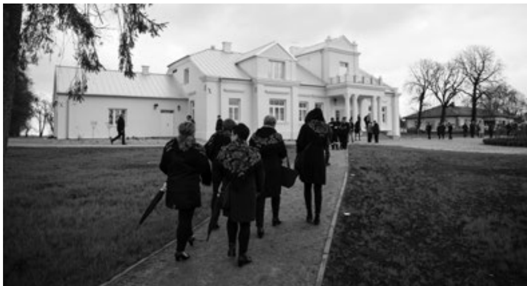
Dwór zyskał nie tylko nową elewację, ale także nową funkcjonalność wewnątrz

Widok z lotu ptaka na odrestaurowany dwór w Stawie Noakowskim oraz otaczający budynek park z drzewami, alejkami, altaną i tarasem widokowym