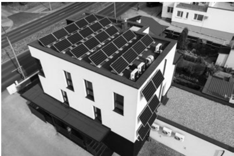
Bemar – modernizacja budynku