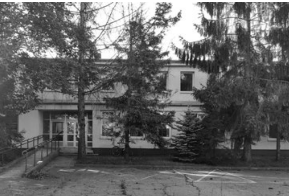
Budynek opuszczony przez filię WOMP, po remoncie stanie się tymczasowym ośrodkiem pobytu dla uchodźców z Ukrainy

nalny Program Operacyjny Województwa Lubelskiego na lata 2014–2020.