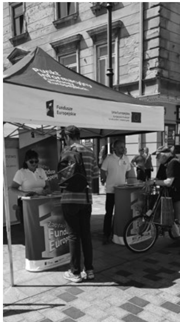
Punkty PIFE zawsze cieszą się znacznym zainteresowaniem.