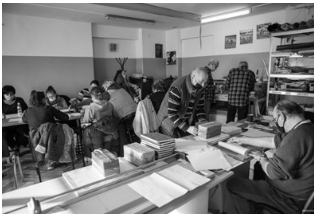
Stowarzyszenie POSTIS realizujące projekt „Aktywni w Centrum” zajęło się bezrobotnymi korzystającymi ze świadczeń pomocy w gminie Świdnik