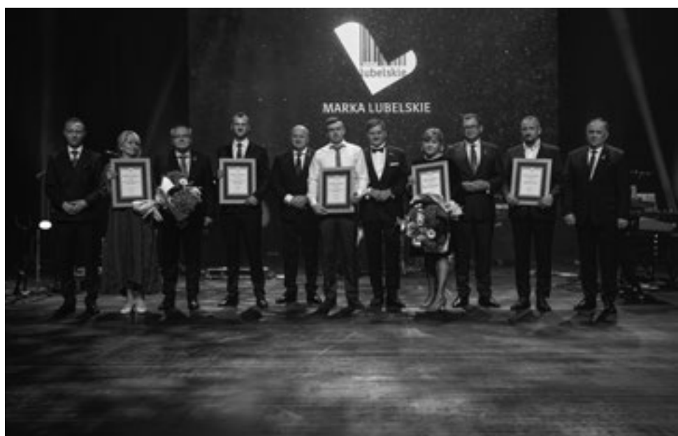
Zarząd Województwa Lubelskiego w towarzystwie laureatów tegorocznej edycji Gali Ambasador Województwa Lubelskiego