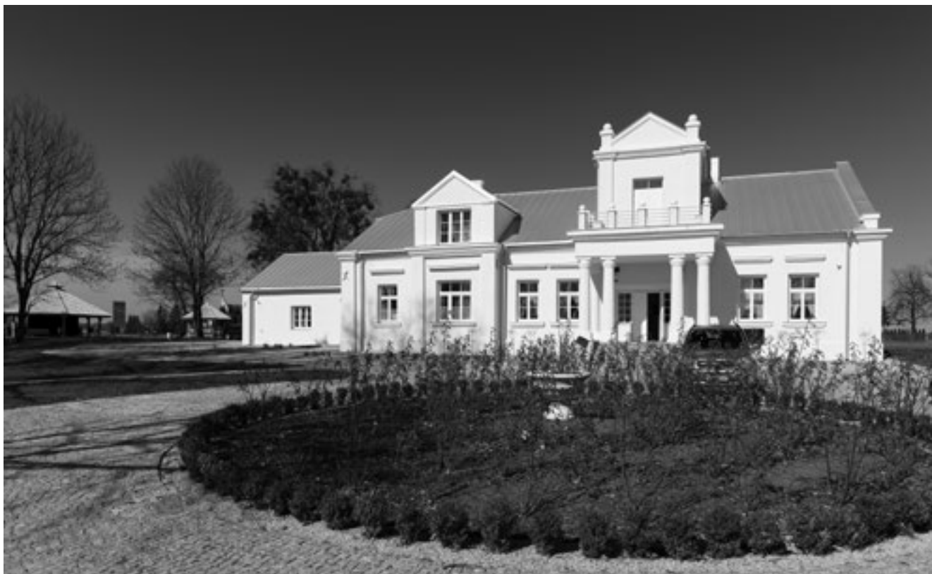
Elewacja frontowa odrestaurowanego dworku w Stawie Noakowskim

Z uwagi na bardzo zły stan techniczny dwór wymagał przeprowadzenia gruntownych prac remontowo-konserwatorskich łącznie z wymianą okien, drzwi i dachu oraz wymiany instalacji elektrycznych i sanitarnych. Na poddaszu odrestaurowanego budynku powstały pokoje z 14 miejscami noclegowymi, a na parterze miejsca szkoleniowe, sala restauracyjna, sala fitness i sale warsztatowe. Dodatkowo w piwnicach znajduje się siłownia oraz pomieszczenie, w którym zaplanowano budowę sauny.