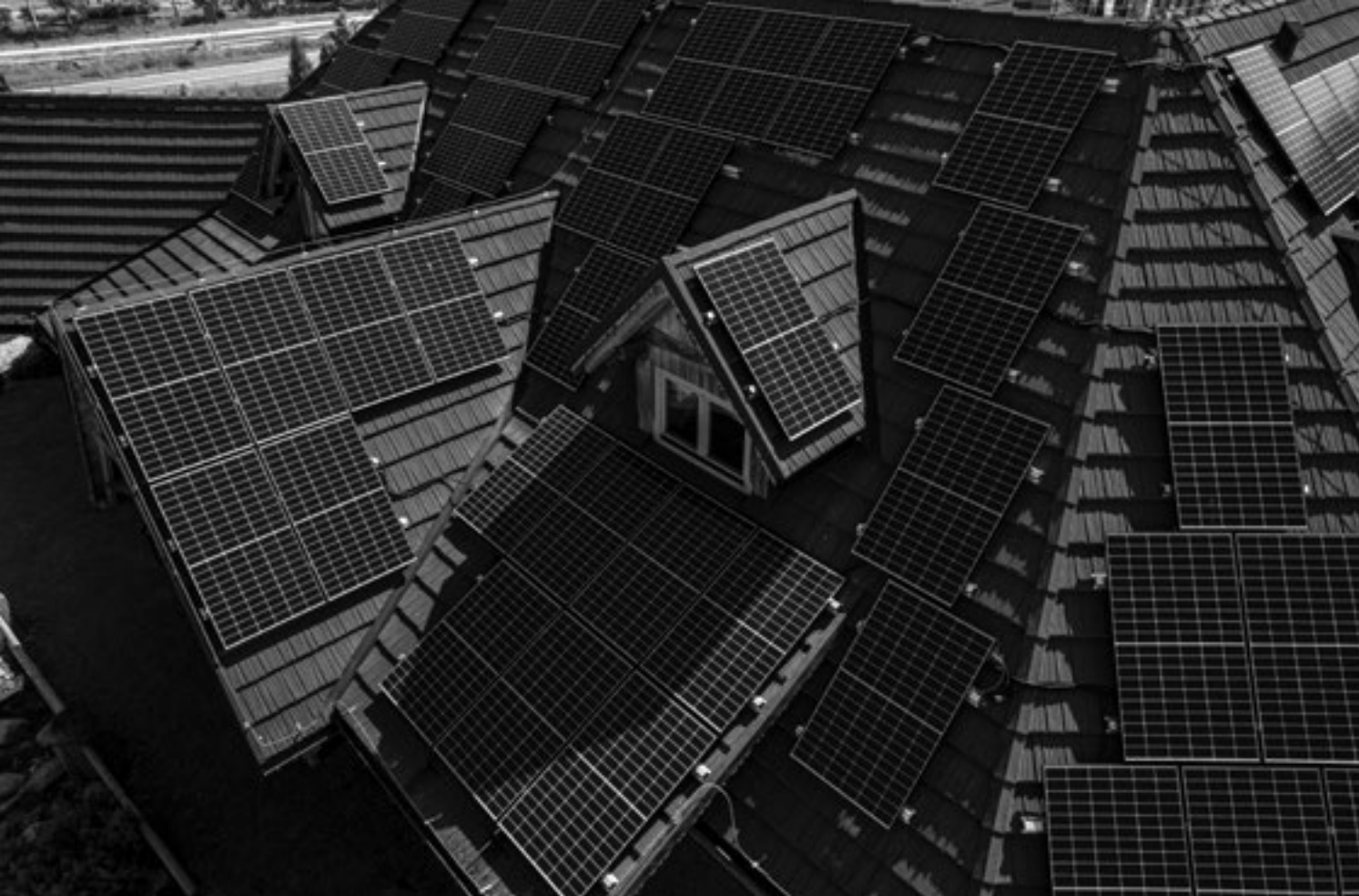
Produkcja energii z OZE w Zajeździe Hajduk w Lublinie

LAWP podzieliła nabór wniosków na 3 rundy, w których wpłynęło łącznie 649 wniosków o dofinansowanie projektu na całkowitą wartość wynoszącą blisko 819 mln zł, w tym wnioskowane dofinansowanie z UE w wysokości prawie 385,5 mln zł. Stanowi to 410,35% alokacji unijnej pierwotnie przeznaczanej na nabór.