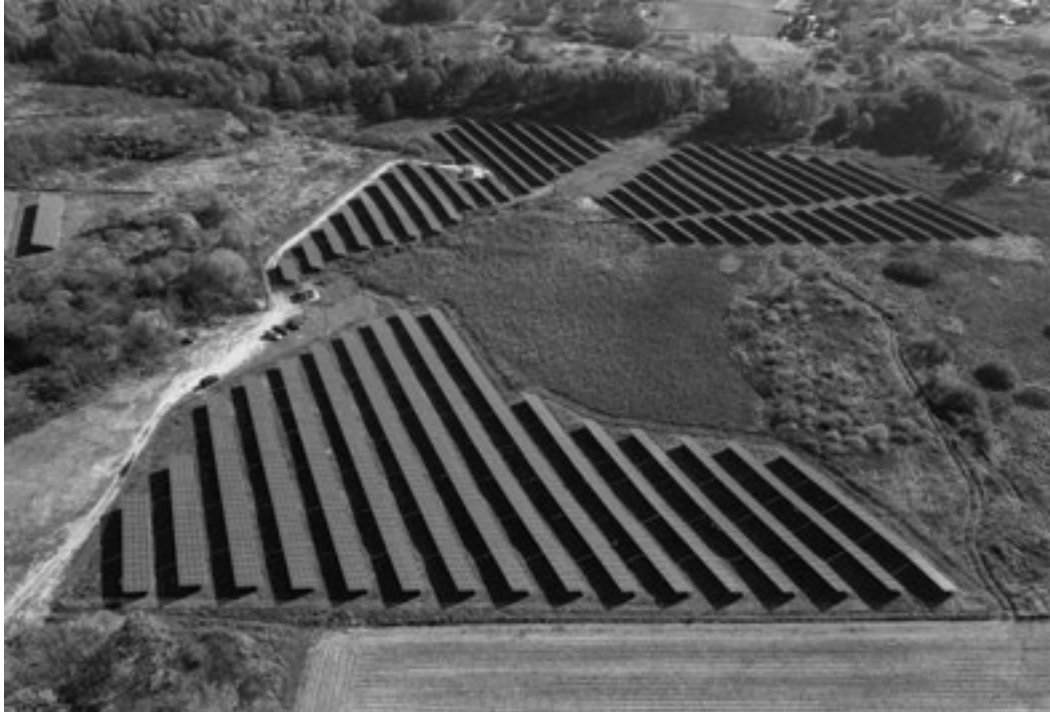
Realizacja projektu firmy Jacek Zabandzała – Serwis Samochodowy BOSCH.

iczną, która zaspokoi jej potrzeby energetyczne.