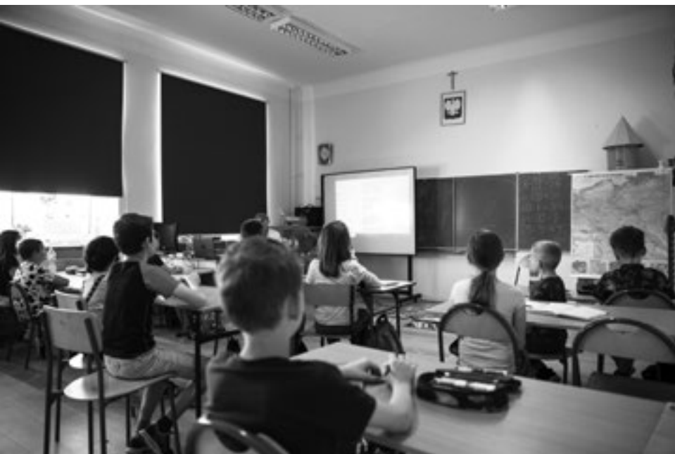
Gmina Spiczyn realizuje w swoich szkołach projekt „Kompetencje kluczowe w gminie Spiczyn”

lat 3, co umożliwiło ich opiekunom, głównie kobietom, powrót na rynek pracy.