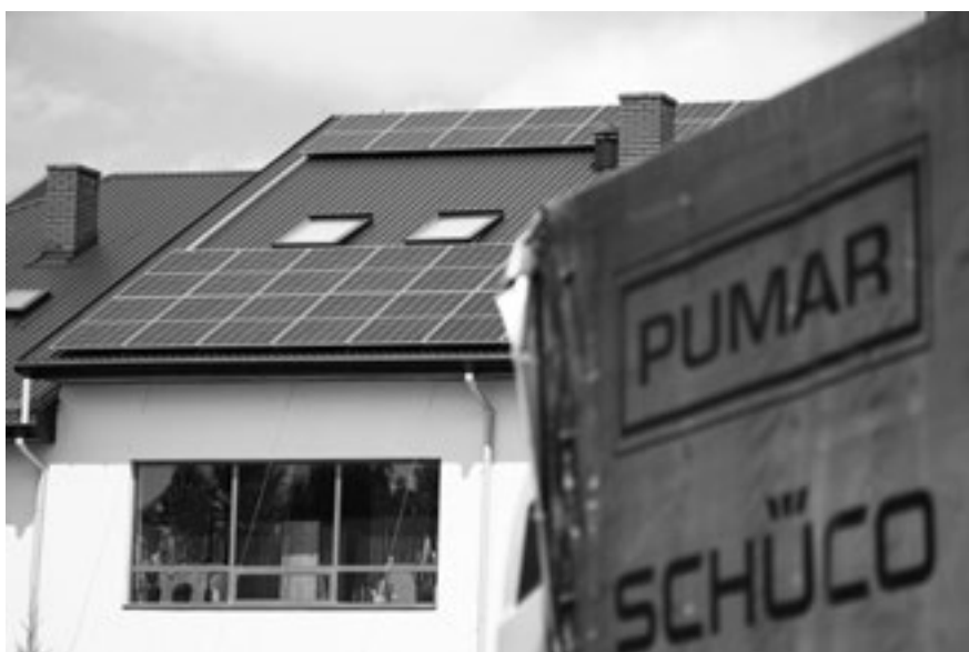
Wiele przedsiębiorstw Lubelszczyzny już wykorzystuje energię pochodzącą ze źródeł odnawialnych

– Wydaliśmy dotychczas na OZE ponad miliard złotych – mówi Marszałek Jarosław Stawiarski. – W trakcie realizacji działań finansowanych z REACT-EU ta kwota wzrośnie jeszcze o 125 milionów. Pragnę jednak zapewnić, że także w perspektywie finansowej Unii Europejskiej na lata 2022–2027 nadal będziemy wspierać rozwój „zielonej energii” w regionie.