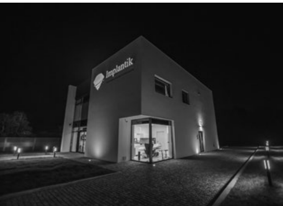
Siedziba firmy Implantik. Autor: Implantik