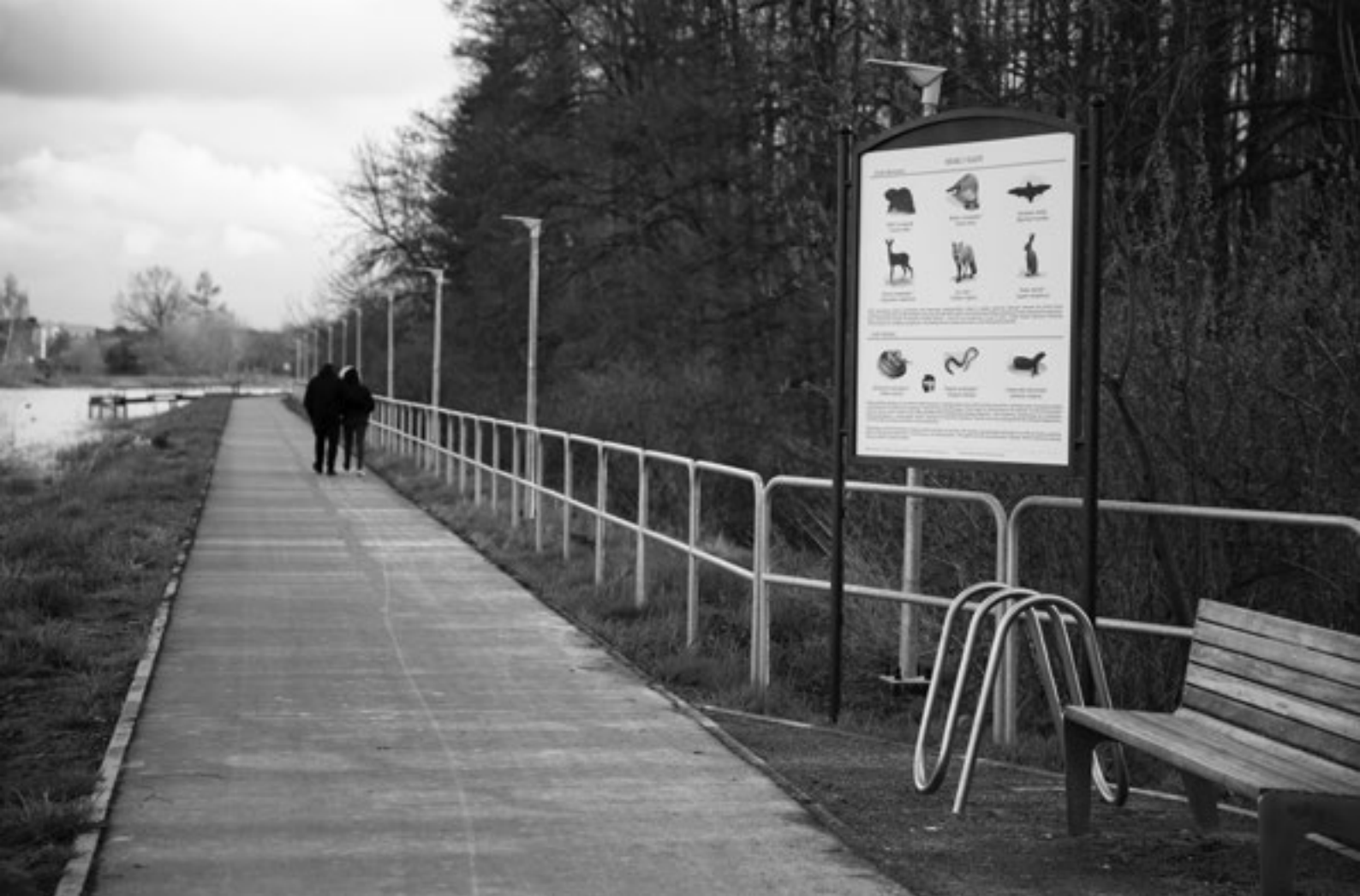
Ścieżka pieszo-rowerowa przy zalewie w Zamościu i zatoczek z ławką, stojakiem na rowery i tablicą edukacyjną

i inną roślinnością, zapewniające odpowiednie warunki dziko żyjącym zwierzętom. Wzdłuż zalewu wykonano ścieżkę pieszo-rowerową wraz z oświetleniem oraz zatoczkami wyposażonymi w ławki, stojaki rowerowe i kosze na śmieci. Ścieżka ta stanowi jednocześnie dydaktyczną ścieżkę przyrodniczą z tablicami informacyjno-edukacyjnymi, dotyczącymi przyrodniczych uwarunkowań terenu, aspektów ochrony środowiska oraz przedstawiającymi występujące na tym terenie gatunki roślin i zwierząt. Na trasie ścieżki wybudowano również skierowany w stronę lasu pomost oraz kładkę, służące do obserwacji przyrody