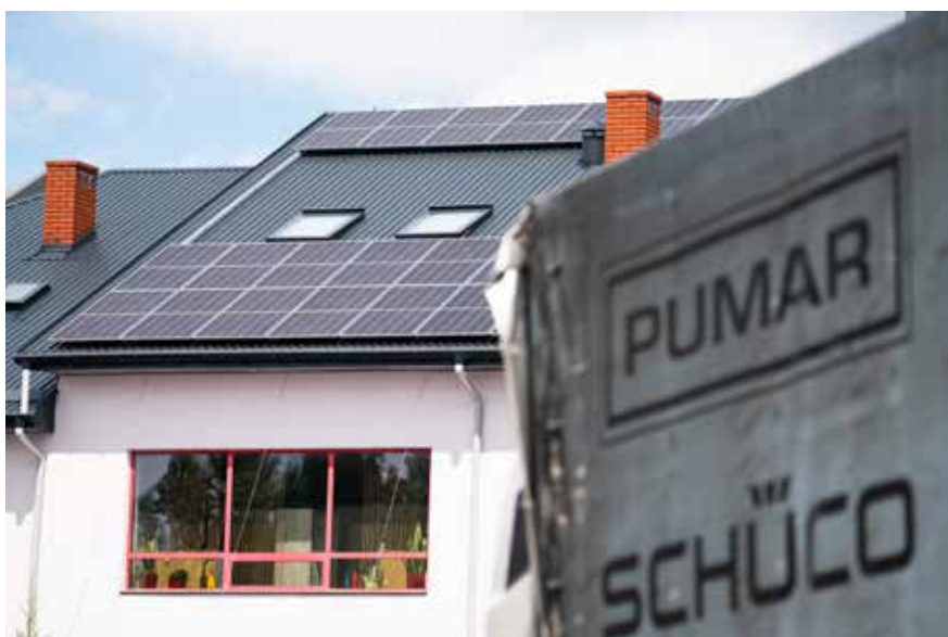
Wiele przedsiębiorstw Lubelszczyzny wykorzystuje już energię pochodzącą ze źródeł odnawialnych

– Wydaliśmy dotychczas na OZE ponad miliard złotych – mówi Marszałek Jarosław Stawiarski. – Realizując działania finansowane z REACT-EU, ta kwota wzrośnie jeszcze o 125 milionów. Pragnę jednak zapewnić, że także w perspektywie finansowej Unii Europejskiej na lata 2022–2027 nadal będziemy wspierać rozwój „zielonej energii” w regionie.