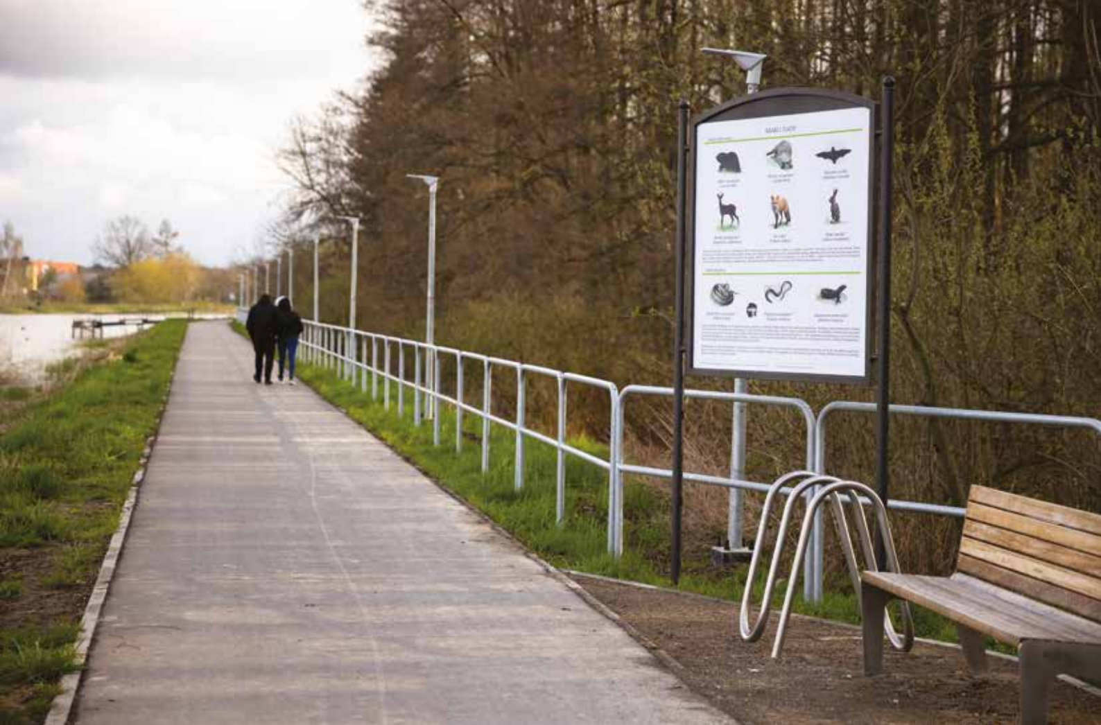
Ścieżka pieszo-rowerowa przy zalewie w Zamościu i zatoczek z ławką, stojakiem na rowery i tablicą edukacyjną

i inną roślinnością, zapewniające odpowiednie warunki dziko żyjącym zwierzętom. Wzdłuż zalewu wykonano ścieżkę pieszo-rowerową wraz z oświetleniem oraz zatoczkami wyposażonymi w ławki, stojaki rowerowe i kosze na śmieci. Ścieżka ta stanowi jednocześnie dydaktyczną ścieżkę przyrodniczą z tablicami informacyjno-edukacyjnymi, dotyczącymi przyrodniczych uwarunkowań terenu, aspektów ochrony środowiska oraz przedstawiającymi występujące na tym terenie gatunki roślin i zwierząt. Na trasie ścieżki wybudowano również skierowany w stronę lasu pomost oraz kładkę, służące do obserwacji przyrody