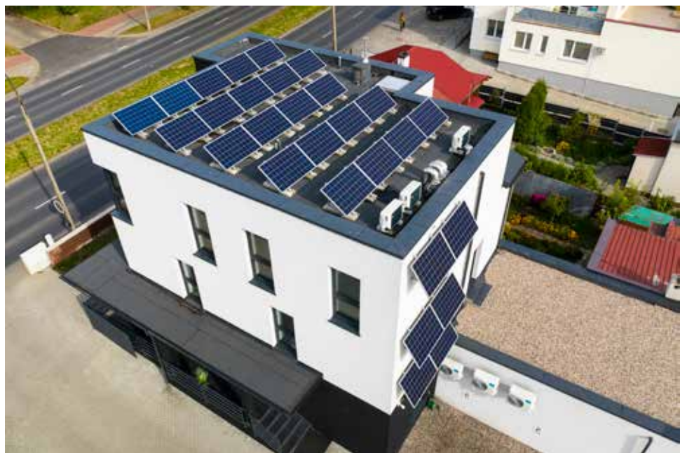
Bemar - modernizacja budynku