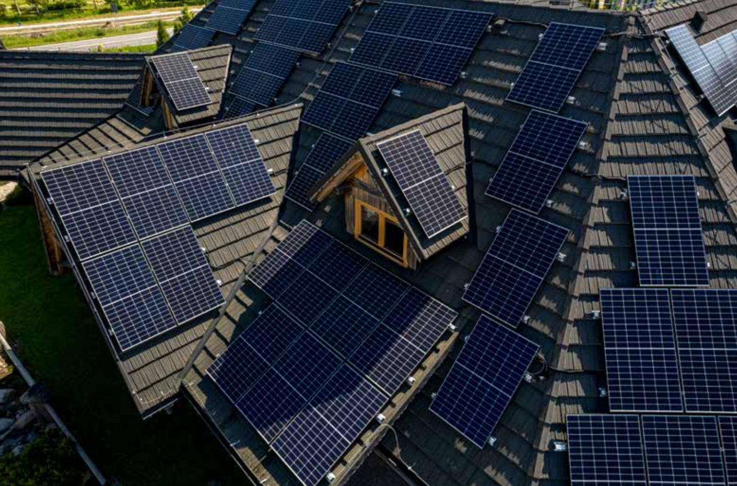
Produkcja energii z OZE w Zajeździe Hajduk w Lublinie

LAWP podzieliła nabór wniosków na 3 rundy, w których wpłynęło łącznie 649 wniosków o dofinansowanie projektu na całkowitą wartość wynoszącą blisko 819 mln zł, w tym wnioskowane dofinansowanie z UE w wysokości prawie 385,5 mln zł. Stanowi to 410,35 % alokacji unijnej pierwotnie przeznaczanej na nabór.