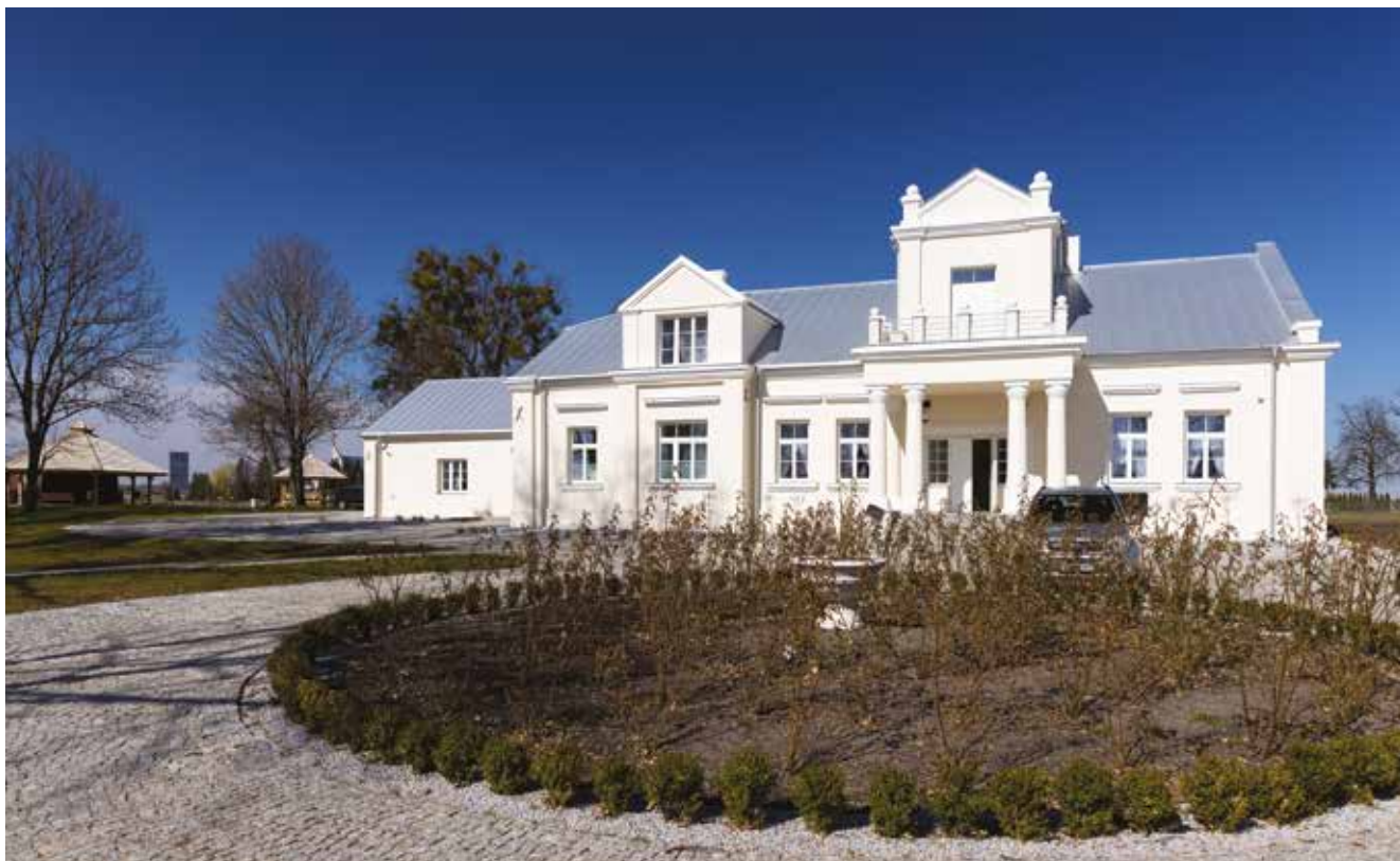
Elewacja frontowa odrestaurowanego dworku w Stawie Noakowskim

Z uwagi na bardzo zły stan techniczny dwór wymagał przeprowadzenia gruntownych prac remontowo-konserwatorskich łącznie z wymianą okien, drzwi i dachu oraz wymiany instalacji elektrycznych i sanitarnych. Na poddaszu odrestaurowanego budynku powstały pokoje z 14 miejscami noclegowymi, a na parterze miejsca szkoleniowe, sala restauracyjna, sala fitness i sale warsztatowe. Dodatkowo w piwnicach znajduje się siłownia oraz pomieszczenie, w którym zaplanowano budowę sauny.