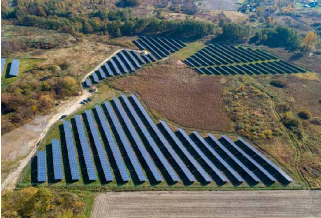
Realizacja projektu firmy Jacek Zabandzała – Serwis Samochodowy BOSCH.

iczną, która zaspokoi jej potrzeby energetyczne.