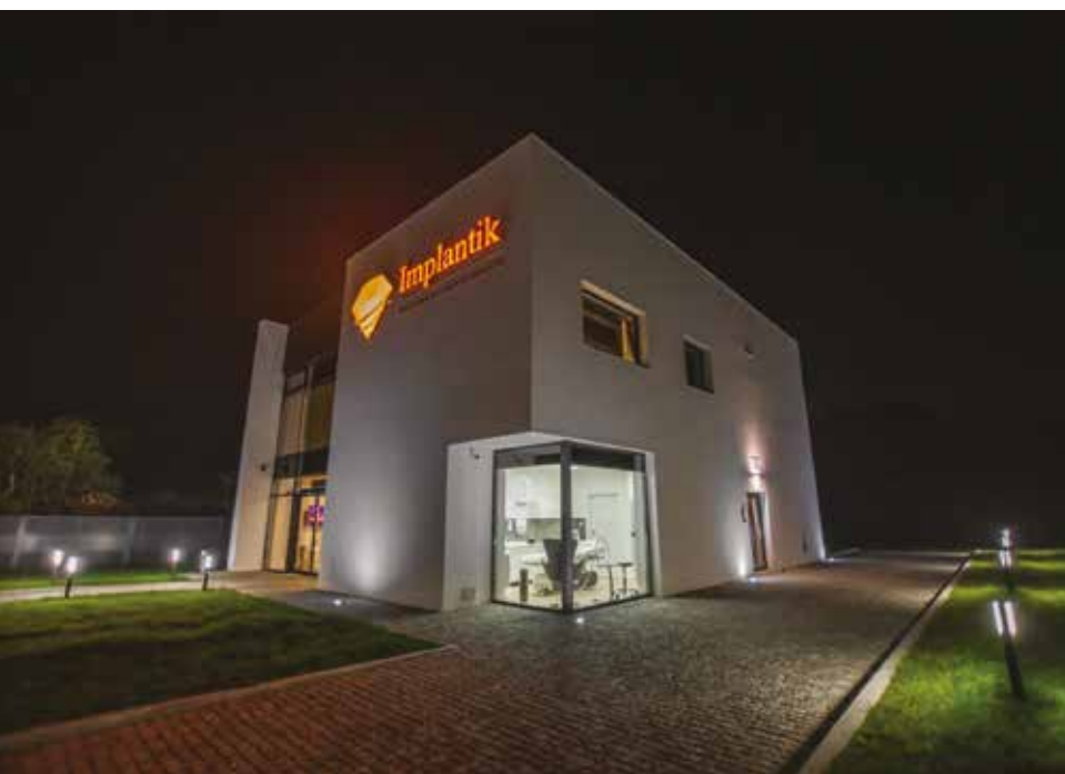
Siedziba firmy Implantik. Autor: Implantik