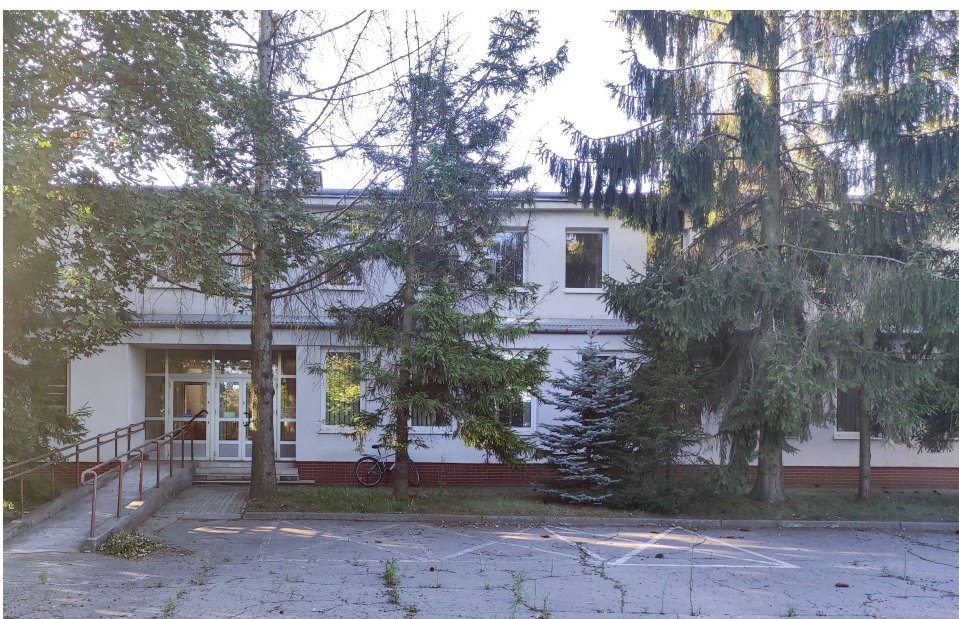
Budynek opuszczony przez filię Wojewódzkiego Ośrodka Medycyny Pracy, po remoncie stanie się tymczasowym ośrodkiem pobytu dla uchodźców z Ukrainy

czonych w interesie ogólnym”, Regionalny Program Operacyjny Województwa Lubelskiego na lata 2014–2020. Realizacja działań w tym projekcie umożliwiła wyposażenie 213 ośrodków pomocy społecznej, 20 powiatowych centrów pomocy rodzinie, 11 instytucji opieki paliatywno-hospicyjnej oraz 10 schronisk dla osób bezdomnych w sprzęt niezbędny do walki ze skutkami COVID-19 oraz środki ochrony osobistej. Wartość projektu to ponad 7 mln złotych.