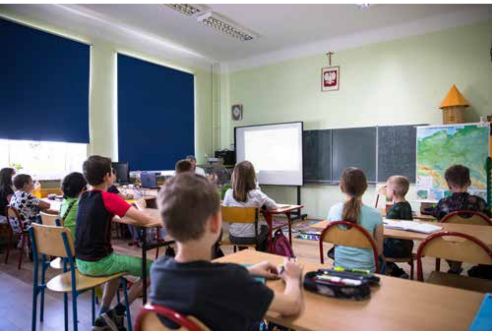
Gmina Spiczyn realizuje w swoich szkołach projekt „Kompetencje kluczowe w gminie Spiczyn”

lat 3, co umożliwiło ich opiekunom, głównie kobietom, powrót na rynek pracy.