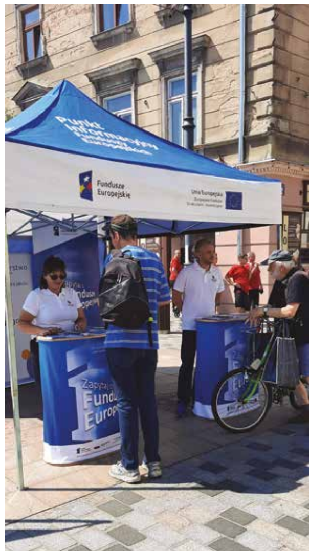
Punkty PIFE zawsze cieszą się znacznym zainteresowaniem.