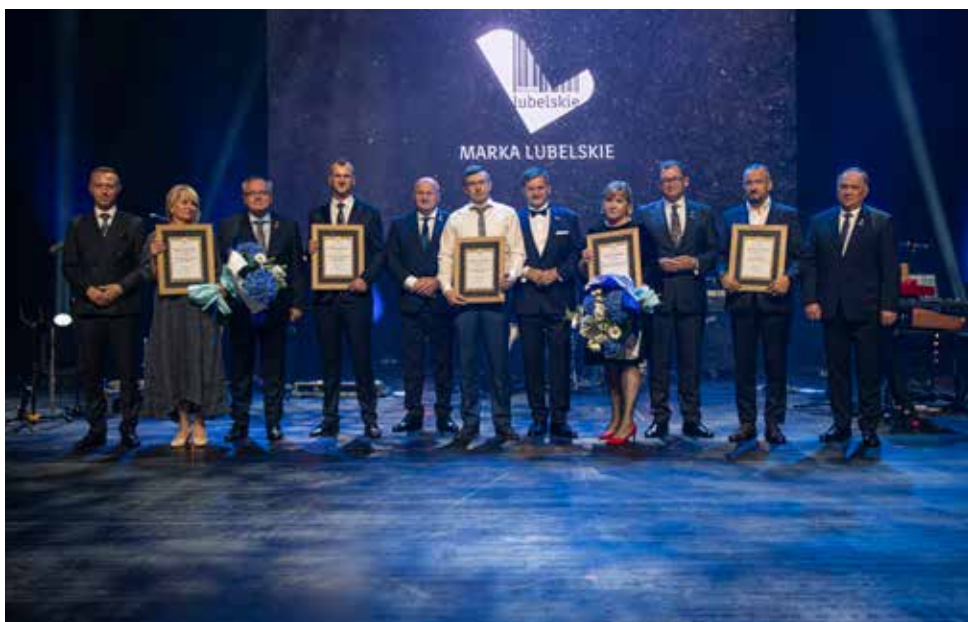
Zarząd Województwa Lubelskiego w towarzystwie laureatów tegorocznej edycji Gali Ambasador Województwa Lubelskiego