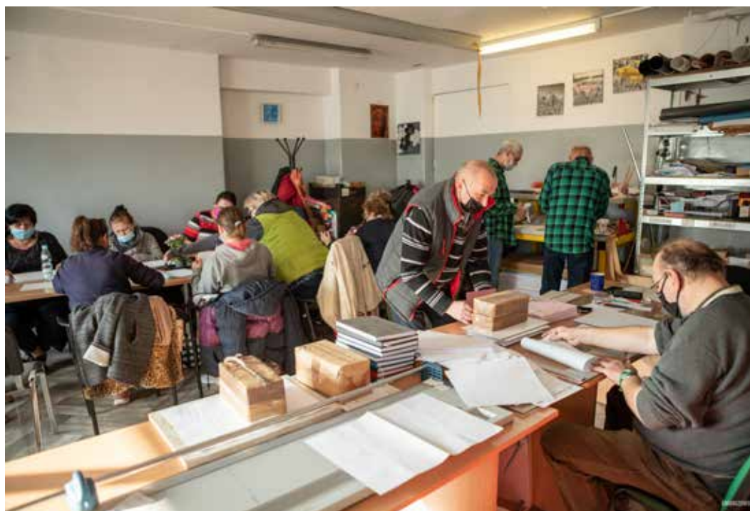
Stowarzyszenie POSTIS realizujące projekt „Aktywni w Centrum” zajęło się bezrobotnymi korzystającymi ze świadczeń pomocy w gminie Świdnik