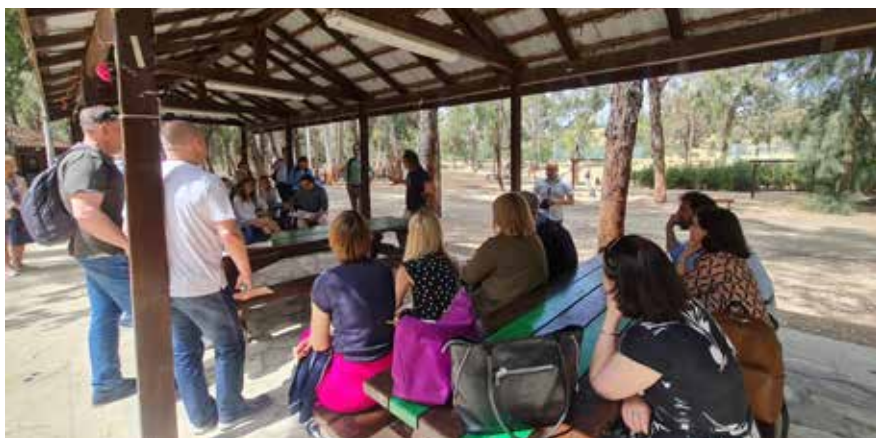
Park leśny Athalassa – dobra praktyka z Cypru Na zdjęciu uczestnicy wizyty studyjnej siedzący na drewnianych ławkach w parku i słuchający przewodnika.

Trzy lata temu w Hiszpanii ośmiu partnerów, pochodzących z różnych regionów Europy, po raz pierwszy spotkało się, aby zastanowić się i przedyskutować odpowiedź na pytanie, w jaki sposób małe miasta położone w peryferyjnych regionach mogłyby wpływać na promowanie zrównoważonych polityk miejskich.