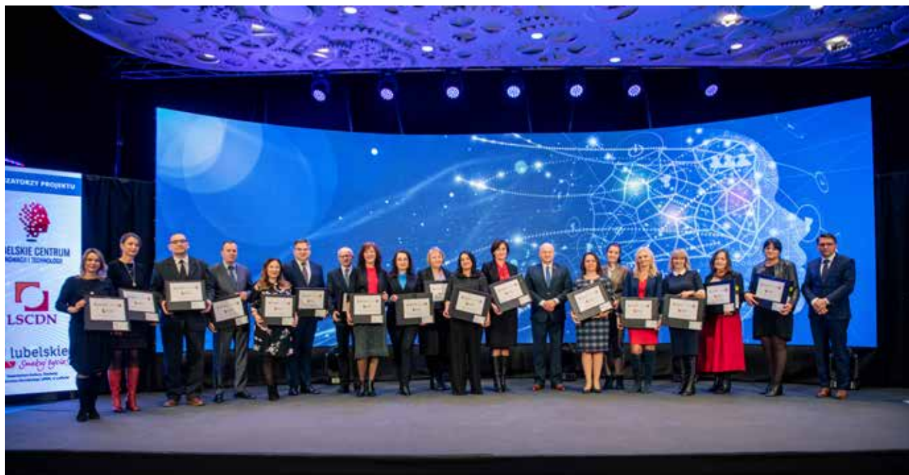
Wspólne zdjęcie przedstawicieli placówek edukacyjnych, które otrzymały wsparcie z Regionalnego programu Operacyjnego Województwa Lubelskiego

Nauczyciele, pracownicy bibliotek pedagogicznych, doradcy metodyczni, konsultanci oraz pracownicy publiczni potrzebują wiedzy specjalistycznej oraz takiej, która nadążałaby za współczesnym światem i jego możliwościami. To właśnie fundusze europejskie dają szansę na dalszy rozwój.