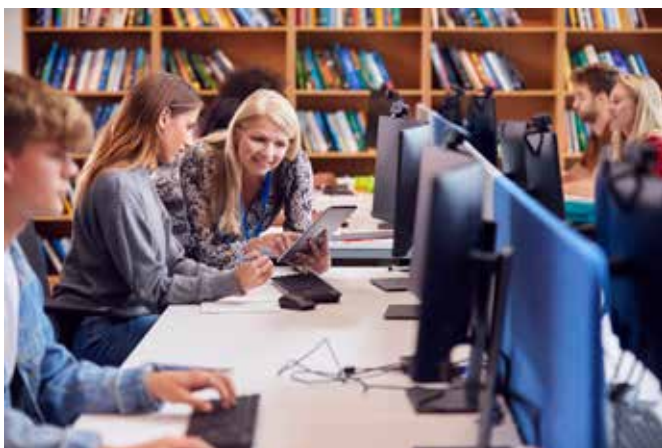
Nowoczesna biblioteka, to nie tylko księgozbiór. Dzięki Funduszom Europejskim biblioteki w naszym województwie podążają ku nowoczesności.