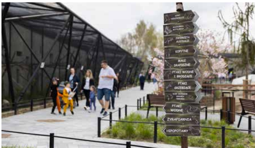
Na wizytę w zamojskim zoo warto przeznaczyć co najmniej trzy godziny. Na pewno będzie czas świetnie wykorzystany.

Wizyta w zoo to nieodłączny element szczęśliwego dzieciństwa. Mieszkańcy Lubelszczyzny mają do dyspozycji jeden z najnowocześniejszych obiektów zoologicznych w kraju. Na zwiedzenie Ogrodu Zoologicznego im. Stefana Milera w Zamościu zarezerwujcie nie mniej niż 3 godziny. Dzieciaki będą zachwycone!