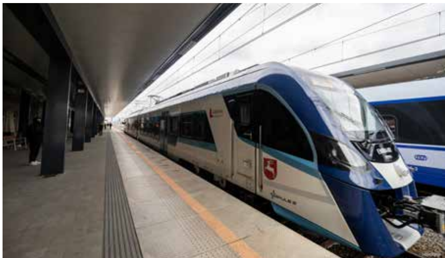
Przemysłowe inwestycje w transport kolejowy powodują, że na kolejnych liniach pojawiać się będą nowoczesne pociągi

Dzięki dodatkowym pieniądzą z Regionalnego Programu Operacyjnego Województwa Lubelskiego nad linią kolejową łączącą Lubartów z Parczewem wybudowana zostanie kładka dla pieszych. We wtorek 8 listopada br. podpisany został aneks do umowy o dofinansowaniu projektu „Rewitalizacja linii kolejowej nr 30 na odcinku Lubartów - Parczew”