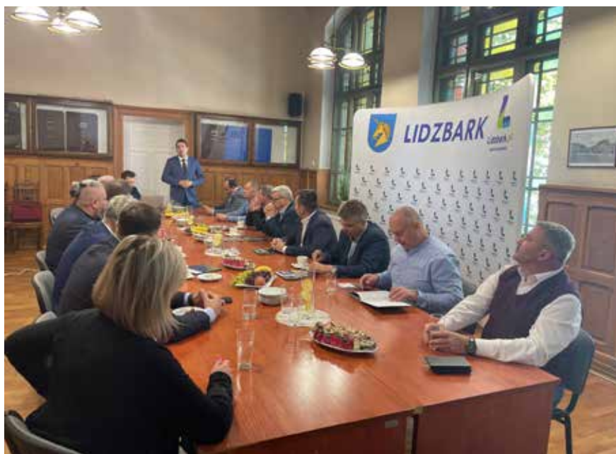
Przedstawiciele JST z województwa lubelskiego oraz pracownicy UMWL na wizycie studyjnej w Gminie Miejsko- Wiejskiej Lidzbark

Podsumowaniem szkoleń i wzmocnieniem przekazanej wiedzy w praktyce było 6 wizyt studyjnych, w których wzięli udział starostowie, wójtowie, burmistrzowie oraz sekretarze z województwa lubelskiego. Łącznie w wizytach uczestniczyły 94 jednostki samorządu terytorialnego. Dobrymi praktykami i doświadczeniem zdobytym podczas obsługi inwestorów, a także wnioskami