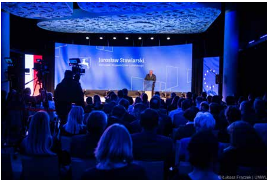
6 grudnia 2022 roku oficjalnie zainaugurowany został proces wdrażania programu regionalnego na lata 2021-2027.

Pieniądze, jakie składają się na program Fundusze Europejskie dla Lubel-