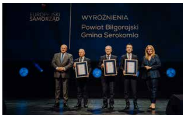
Na zdjęciu od lewej: Jarosław Stawiarski - Marszałek Województwa Lubelskiego; Andrzej Rolla - Starosta Powiatu Kraśnickiego; Piotr Chaber - Wójt Gminy Serokomla; Andrzej Szarlip - Starosta Powiatu Biłgorajskiego; Beata Mazurek - posłanka do Parlamentu Europejskiego.