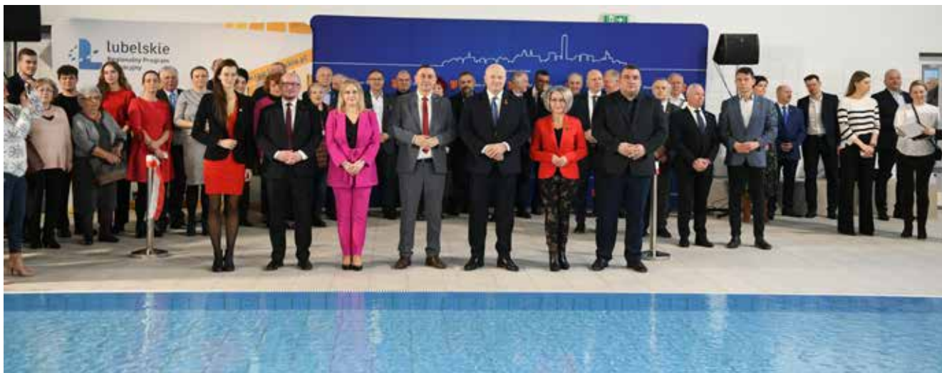
Na otwarcie wyremontowanego basenu mieszkańcy Kraśnika czekali od dawna.