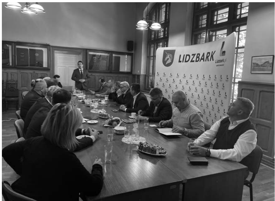
Przedstawiciele JST z województwa lubelskiego oraz pracownicy UMWL na wizycie studyjnej w Gminie Miejsko- Wiejskiej Lidzbark

Podsumowaniem szkoleń i wzmocnieniem przekazanej wiedzy w praktyce było 6 wizyt studyjnych, w których wzięli udział starostowie, wójtowie, burmistrzowie oraz sekretarze z województwa lubelskiego. Łącznie w wizytach uczestniczyły 94 jednostki samorządu terytorialnego. Dobrymi praktykami i doświadczeniem zdobytym podczas obsługi inwestorów, a także wnioskami