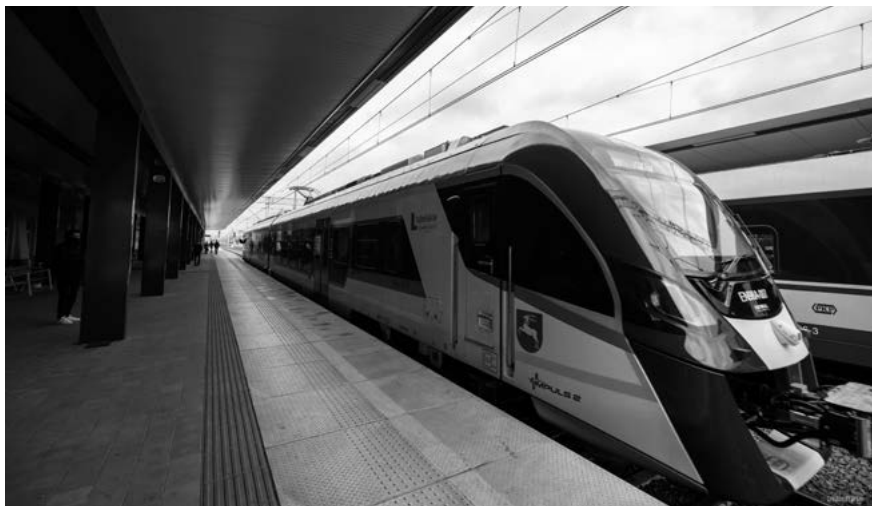
Przemysłane inwestycje w transport kolejowy powodują, że na kolejnych liniach pojawiać się będą nowoczesne pociągi

Dzięki dodatkowym pieniądzą z Regionalnego Programu Operacyjnego Województwa Lubelskiego nad linią kolejową łączącą Lubartów z Parczewem wybudowana zostanie kładka dla pieszych. We wtorek 8 listopada br. podpisany został aneks do umowy o dofinansowaniu projektu „Rewitalizacja linii kolejowej nr 30 na odcinku Lubartów - Parczew”