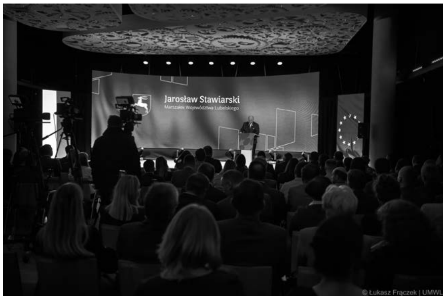
6 grudnia 2022 roku oficjalnie zainaugurowany został proces wdrażania programu regionalnego na lata 2021-2027.

Pieniądze, jakie składają się na program Fundusze Europejskie dla Lubel-