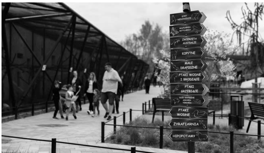
Na wizytę w zamojskim zoo warto przeznaczyć co najmniej trzy godziny. Na pewno będzie czas świetnie wykorzystany.

Wizyta w zoo to nieodłączny element szczęśliwego dzieciństwa. Mieszkańcy Lubelszczyzny mają do dyspozycji jeden z najnowocześniejszych obiektów zoologicznych w kraju. Na zwiedzenie Ogrodu Zoologicznego im. Stefana Milera w Zamościu zarezerwujcie nie mniej niż 3 godziny. Dzieciaki będą zachwycone!