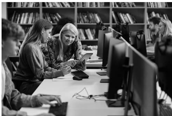
Nowoczesna biblioteka, to nie tylko księgozbiór. Dzięki Funduszom Europejskim biblioteki w naszym województwie podążają ku nowoczesności.