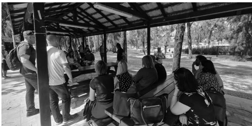
Park leśny Athalassa – dobra praktyka z Cypru Na zdjęciu uczestnicy wizyty studyjnej siedzący na drewnianych ławkach w parku i słuchający przewodnika.

Trzy lata temu w Hiszpanii ośmiu partnerów, pochodzących z różnych regionów Europy, po raz pierwszy spotkało się, aby zastanowić się i przedyskutować odpowiedź na pytanie, w jaki sposób małe miasta położone w peryferyjnych regionach mogłyby wpływać na promowanie zrównoważonych polityk miejskich.