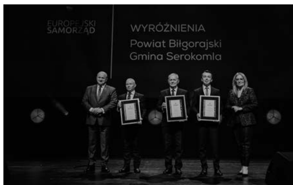
Na zdjęciu od lewej: Jarosław Stawiarski - Marszałek Województwa Lubelskiego; Andrzej Rolla - Starosta Powiatu Kraśnickiego; Piotr Chaber - Wójt Gminy Serokomla; Andrzej Szarlip - Starosta Powiatu Biłgorajskiego; Beata Mazurek - posłanka do Parlamentu Europejskiego.