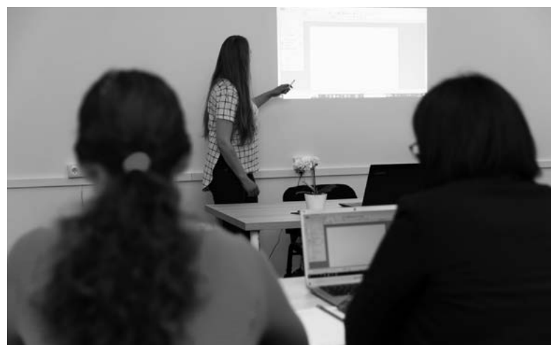
Dzięki wsparciu Funduszy Europejskich ponad 26 tys. osób uzyskało nowe kwalifikacje.