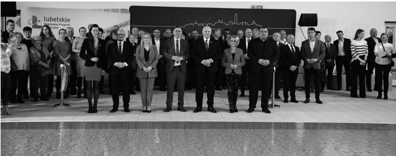
Na otwarcie wyremontowanego basenu mieszkańcy Kraśnika czekali od dawna.