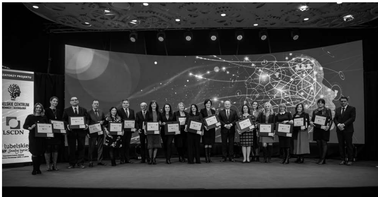
Wspólne zdjęcie przedstawicieli placówek edukacyjnych, które otrzymały wsparcie z Regionalnego programu Operacyjnego Województwa Lubelskiego

Nauczyciele, pracownicy bibliotek pedagogicznych, doradcy metodyczni, konsultanci oraz pracownicy publiczni potrzebują wiedzy specjalistycznej oraz takiej, która nadałaby za współczesnym światem i jego możliwościami. To właśnie fundusze europejskie dają szansę na dalszy rozwój.