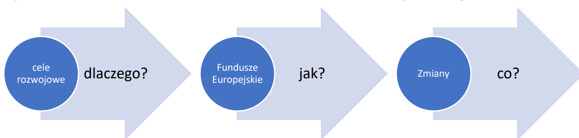
Rys. 1. Schemat: Jak formułować przekaz na temat Funduszy Europejskich?

Kiedy przystępujemy do tworzenia przekazu o Funduszach Europejskich, powinniśmy posługiwać się schematem (rys. 1). Nie ma znaczenia to, czy są to działania informacyjne czy promocyjne i do kogo je kierujemy. Schemat jest uniwersalny.