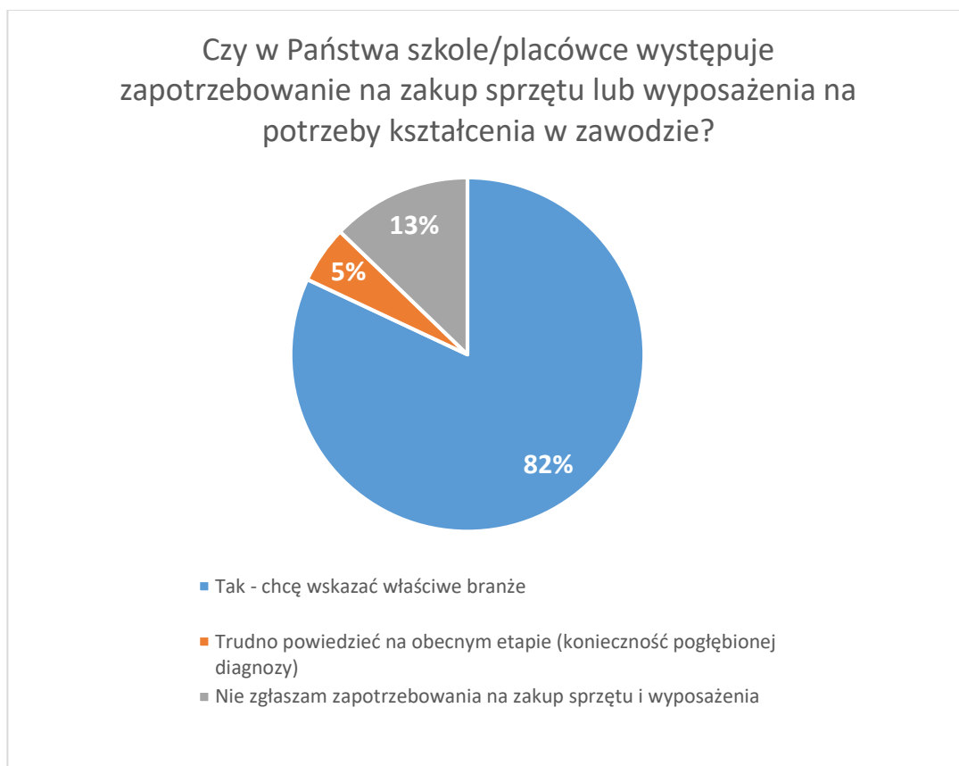
Wykres 1. Występowanie wśród szkół i placówek zapotrzebowania na zakup sprzętu lub wyposażenia

Spośród udzielonych ogółem 172 odpowiedzi, udzielono 141 (82%) odpowiedzi twierdzących, jednocześnie określając branże, w których zdefiniowano zapotrzebowanie na zakup sprzętu lub wyposażenia. Możliwy był wybór kilku spośród wymienionych branż/obszarów: Architektura krajobrazu/Tereny Zielone, Branża Medyczna/Zdrowie, Branża Odzieżowa, Budownictwo, Fryzjerstwo, Gastronomia/Żywnienie, Geodezja, Górnictwo, Handel, Hotelarstwo, Informatyka, Leśnictwo, Lotnictwo/usługi zw. z lotnictwem, Motoryzacja, Rolnictwo, Transport, Turystyka oraz inne wskazane przez respondentów.