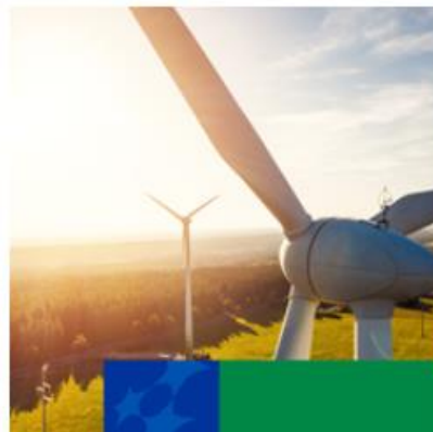
Infrastruktura, Klimat, Środowisko