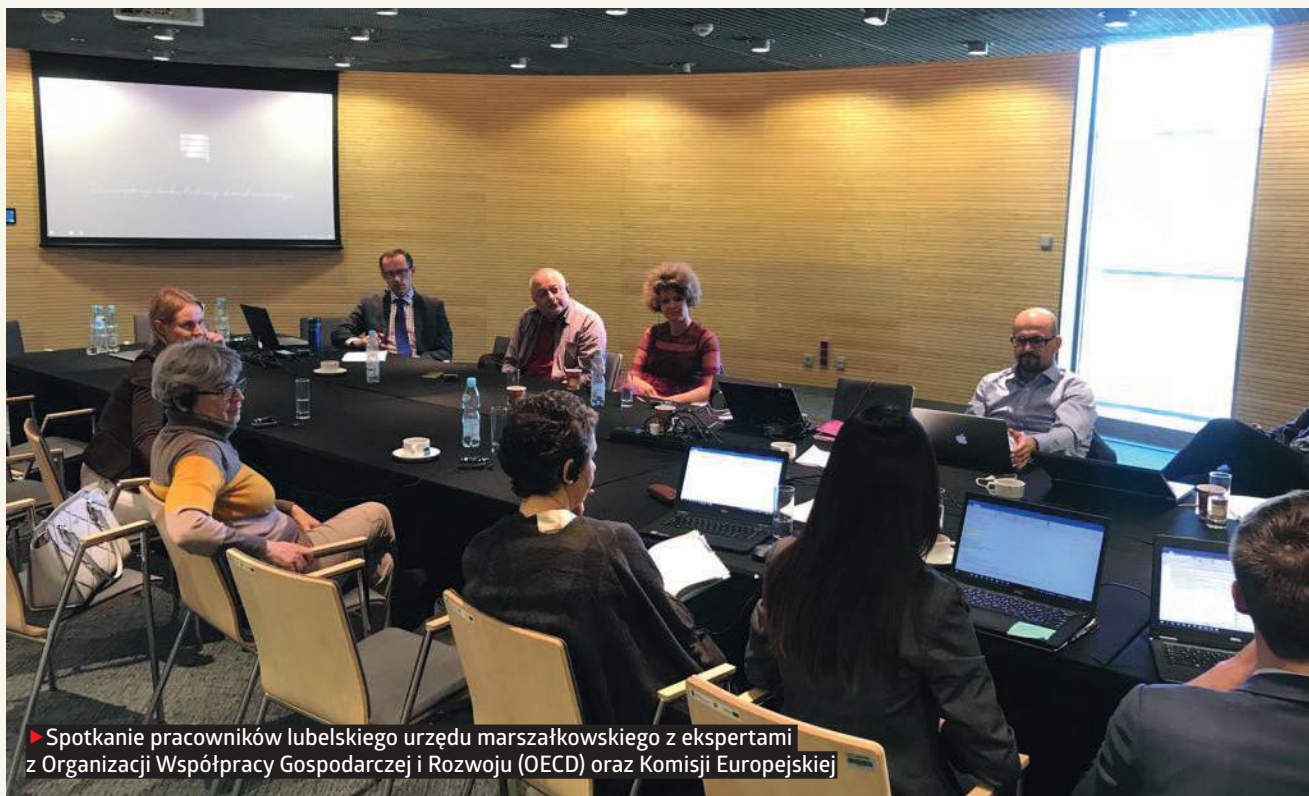
► Spotkanie pracowników lubelskiego urzędu marszałkowskiego z ekspertami z Organizacji Współpracy Gospodarczej i Rozwoju (OECD) oraz Komisji Europejskiej

Lubelskie jest pierwszym regionem, w którym odbyły się warsztaty OECD. Poza naszym województwem do programu zostały zakwalifikowane instytucje zarządzające z Chorwacji, Bułgarii, Hiszpanii i Grecji.