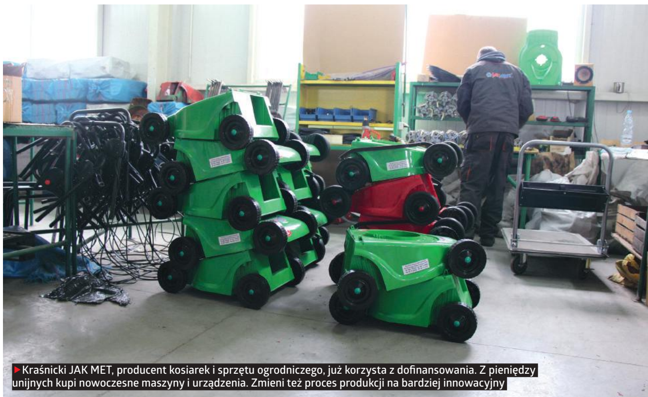
► Kraśnicki JAK MET, producent kosiarek i sprzętu ogrodniczego, już korzysta z dofinansowania. Z pieniędzy unijnych kupi nowoczesne maszyny i urządzenia. Zmieni też proces produkcji na bardziej innowacyjny

Im wyższą wartość tego wskaźnika osiągniesz, tym zwrócisz mniej pieniędzy. Jeśli Twój przychód ze sprzedaży nowych