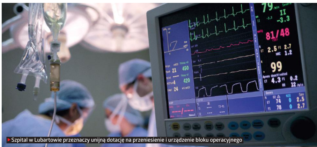
► Szpital w Lubartowie przeznaczy unijną dotację na przeniesienie i urządzenie bloku operacyjnego

Na początek szpital wzbogaci się o długo wyczekiwany tomograf komputerowy. To świetna wiadomość dla pacjentów ze Świdnika i okolic, którzy dotychczas jeździli na badania do Lublina. Teraz będą mieć je na miejscu. Lista sprzętu, w który chce zaopatrzyć się lecznica, jest naprawdę długa. Obok tomografu to m.in.: 3 kardiomonytory, defibrylator, 2 respiratory, monitor KTG i aparat EKG. Do tego stare i wysłużone łóżka, liczące nawet 30 lat, zastąpi 200 nowych, w tym specjalistyczne łóżka elektryczne. – Prace chcemy rozpocząć na początku 2019 r. Szacujemy, że potrwać ok. 2 lat – zdradza dyrektor szpitala.