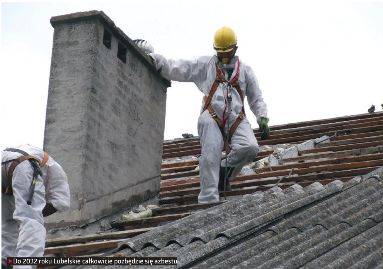
▶ Do 2032 roku Lubelskie całkowicie pozbędzie się azbestu

Już w latach 80. pojawiły się doniesienia o jego szkodliwości. Warto zaznaczyć, że azbest jest niebezpieczny tylko wtedy, gdy jest pokruszony, a jego włókna dostają się do atmosfery. Informacje o tym, że azbest jest rakotwórczy i powoduje wiele innych chorób, sprawiły, że w latach 90.