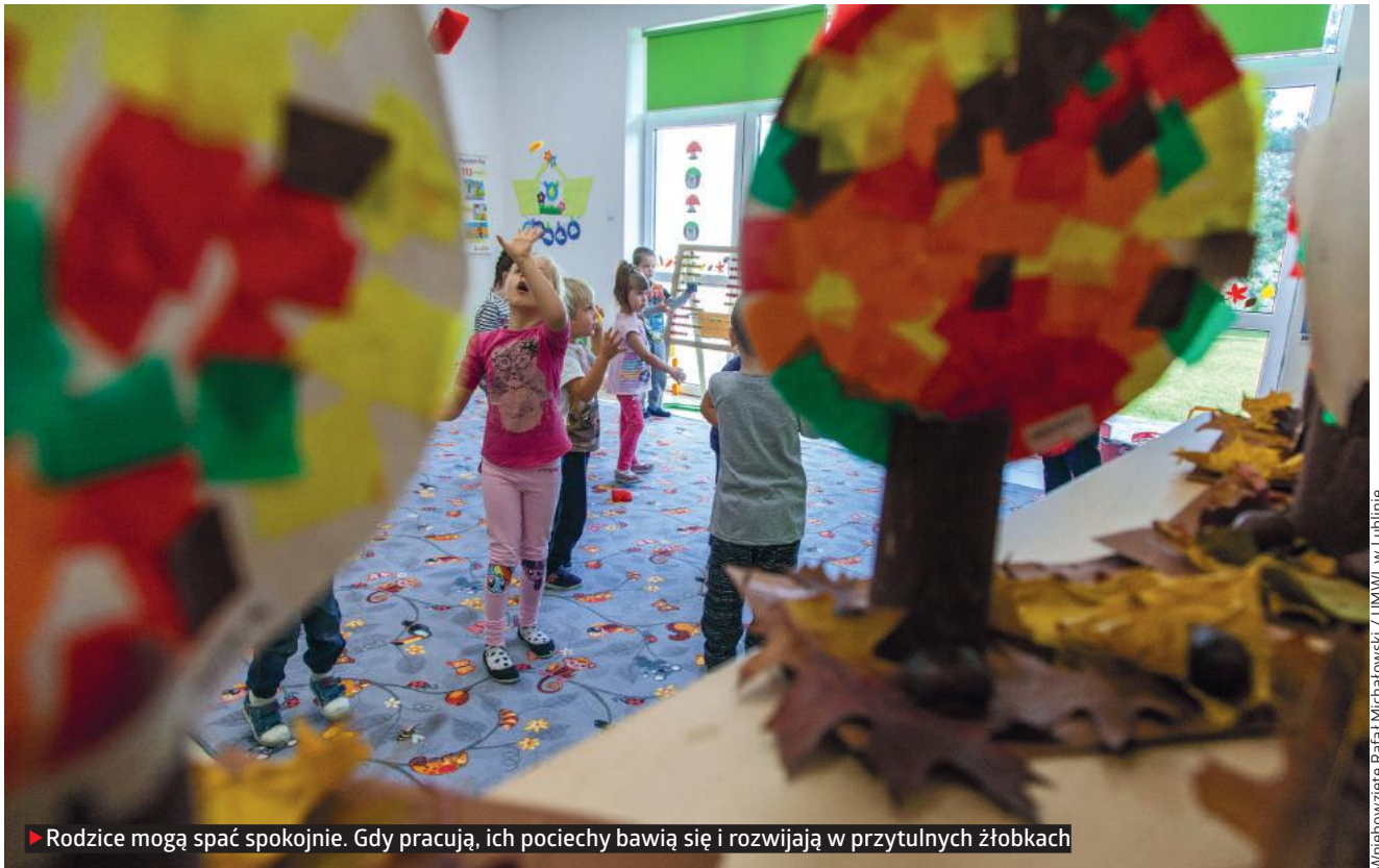
► Rodzice mogą spać spokojnie. Gdy pracują, ich pociechy bawią się i rozwijają w przytulnych żłobkach

Wniebowzięte