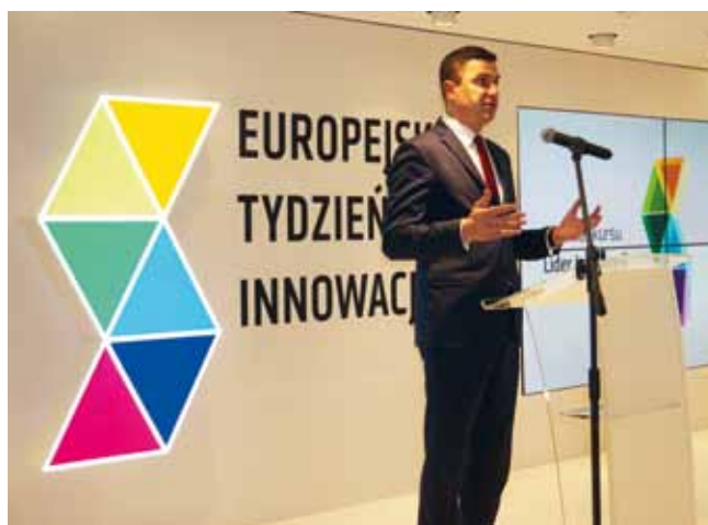
(5 fotografii)