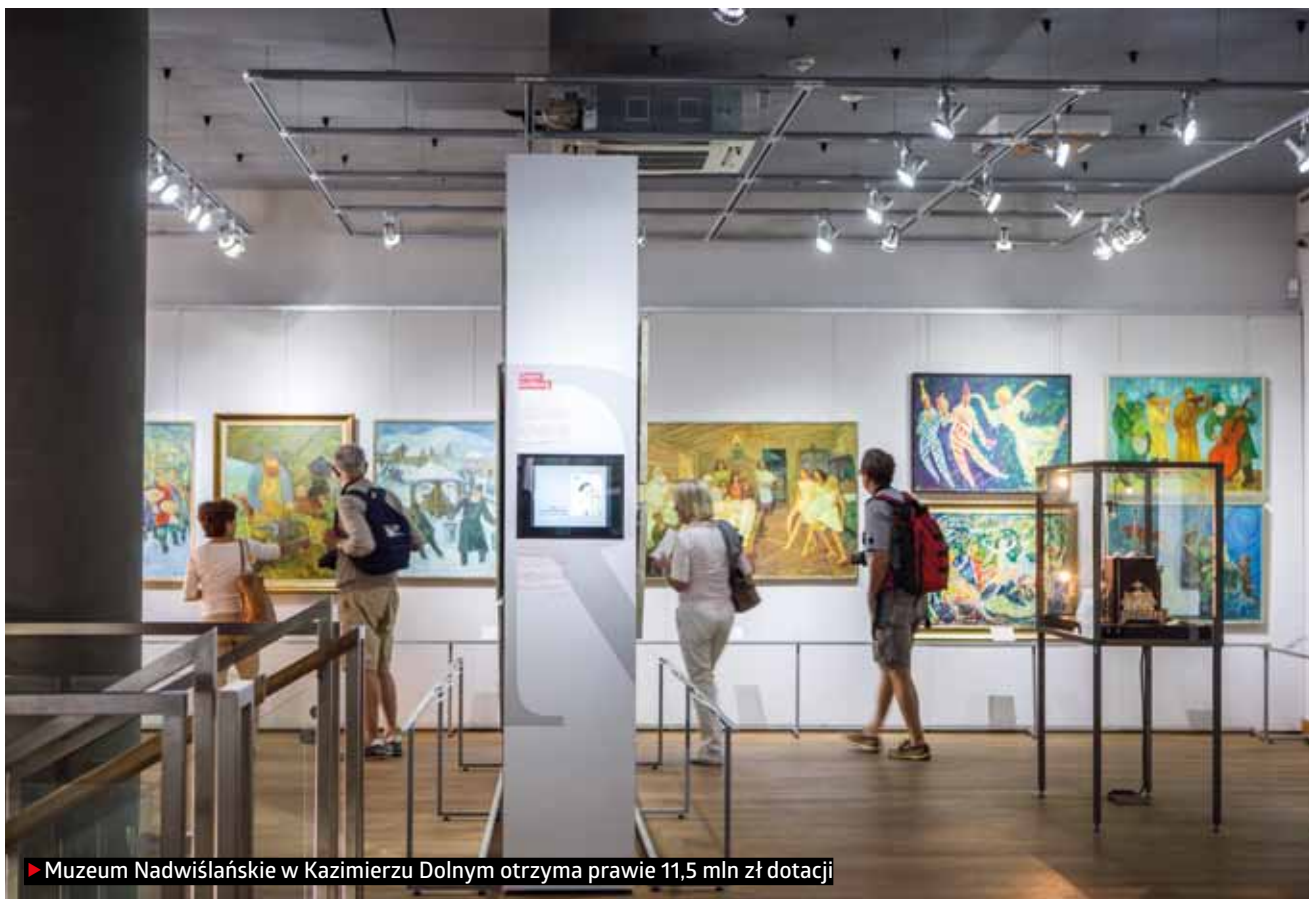
► Muzeum Nadwiślańskie w Kazimierzu Dolnym otrzyma prawie 11,5 mln zł dotacji