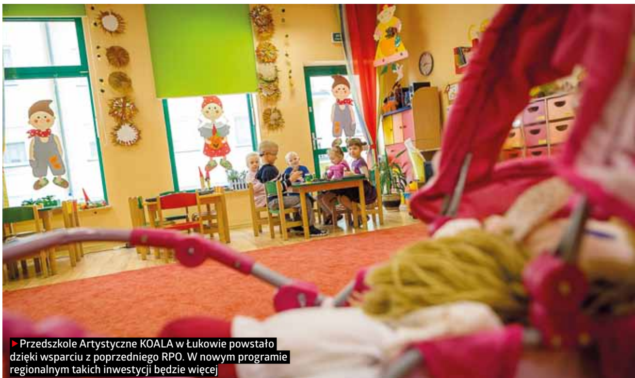
► Przedszkole Artystyczne KOALA w Łukowie powstało dzięki wsparciu z poprzedniego RPO. W nowym programie regionalnym takich inwestycji będzie więcej