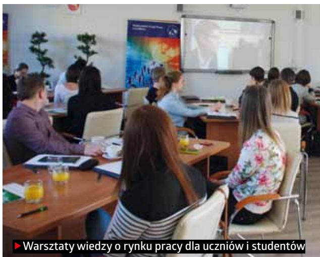
► Warsztaty wiedzy o rynku pracy dla uczniów i studentów

Najważniejsze z punktu widzenia badań rynku pracy przedsięwzięcie to powstanie portalu Wirtualny Doradca ( wirtualnydoradca.wup.lublin.pl ). Jest to kompendium wiedzy z wszystkich badań Obserwatorium. Jest skierowany przede wszystkim do osób, które planują rozpoczęcie kolejnego etapu kształcenia i poszukują informacji na temat kariery osób, które taki kierunek już ukończyły. Mogą z niego również korzystać osoby, które z różnych