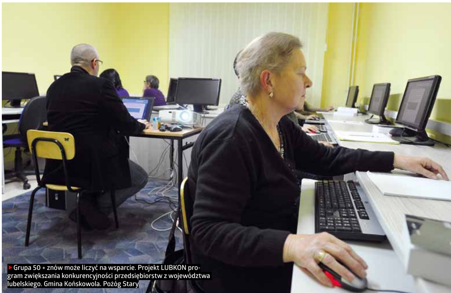
► Grupa 50+ znów może liczyć na wsparcie. Projekt LUBKON program zwiększania konkurencyjności przedsiębiorstw z województwa lubelskiego. Gmina Końskowola. Pożóg Stary