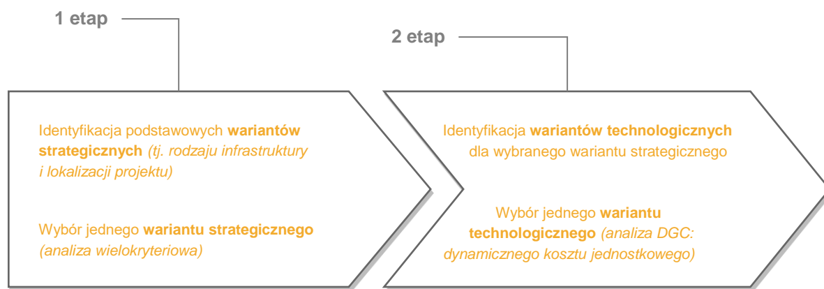
Diagram 2. Etapy analizy wariantów

Analizę wariantów przeprowadza się, aby ocenić i porównać różne alternatywne warianty realizacji celów projektowych i wybrać ten, który zapewni najlepsze rozwiązanie pod względem kryteriów technicznych, instytucjonalnych, ekonomicznych, środowiskowych i związanych ze zmianą klimatu (MIR, 2015). Każdy z ocenianych wariantów musi realizować cele projektowe i zaspokajać potrzeby interesariuszy w odmienny sposób, dzięki czemu analiza będzie bardziej wszechstronna i obiektywna. Analizę wariantów przeprowadza się w dwóch etapach: