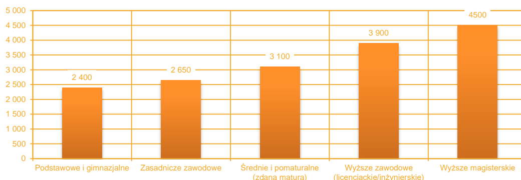
Diagram 3. Wysokość wynagrodzenia (mediana) w zł/m-c w zależności od poziomu wykształcenia.

Edukacja na poszczególnych poziomach kształcenia stwarza możliwość uzyskania nie tylko wyższego poziomu wykształcenia, lecz również wyższej płacy. Wykształcenie stanowi bowiem czynnik, który w sposób szczególnie wyraźny wpływa na poziom otrzymywanego wynagrodzenia, gdyż uzyskany dzięki edukacji poziom wiedzy i umiejętności determinuje zakres obowiązków, na podstawie których wyceniana jest praca. Zależności pomiędzy poziomem uzyskiwanego wynagrodzenia w zależności od poziomu wykształcenia w 2014 roku przedstawiają się następująco: