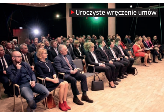
► Uroczyste wręczenie umów