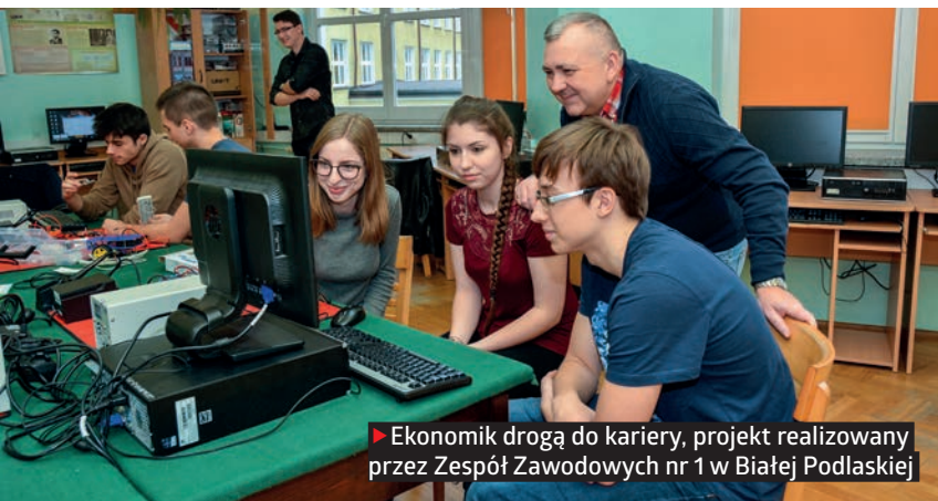
► Ekonomik drogą do kariery, projekt realizowany przez Zespół Zawodowych nr 1 w Białej Podlaskiej