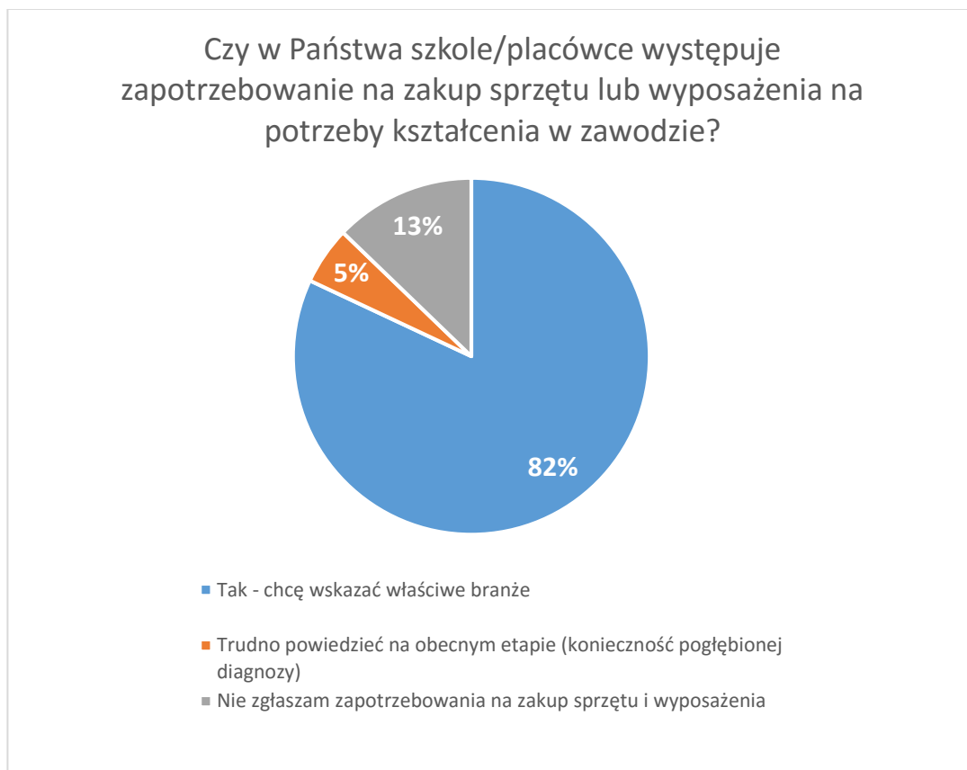
Wykres 2. Występowanie wśród szkół i placówek zapotrzebowania na zakup sprzętu lub wyposażenia

Spośród udzielonych ogółem 172 odpowiedzi, udzielono 141 (82%) odpowiedzi twierdzących, jednocześnie określając branże, w których zdefiniowano zapotrzebowanie na zakup sprzętu lub wyposażenia. Możliwy był wybór kilku spośród wymienionych branż/obszarów: Architektura krajobrazu/Tereny Zielone, Branża Medyczna/Zdrowie, Branża Odzieżowa, Budownictwo, Fryzjerstwo, Gastronomia/Żywność, Geodezja, Górnictwo, Handel, Hotelarstwo, Informatyka, Leśnictwo, Lotnictwo/usługi zw. z lotnictwem, Motoryzacja, Rolnictwo, Transport, Turystyka oraz inne wskazane przez respondentów.